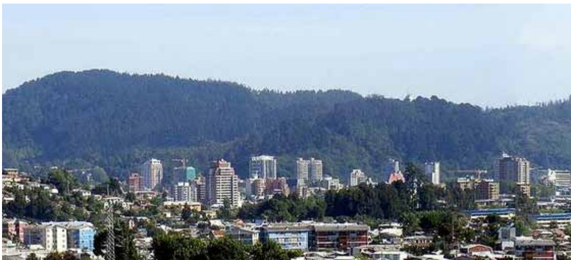
Concepcion - La città è capoluogo dell'omonima provincia e della regione del Bío Bío. È conosciuta come la Perla del Bío-Bío

Mentre la nostra Cooperazione allo Sviluppo non considera il Cile una priorità per gli interventi diretti, in considerazione degli elevati tassi di crescita, operiamo attraverso alcune ONG interessate a progetti di stimolo imprenditoriale, per esempio femminile o legati alle comunità indigene rurali. L'Italia contribuisce alla CEPAL - Commissione Economica per l'America Latina delle Nazioni Unite -, che ha sede a Santiago e progetti diffusi in tutta la Regione. Anche l' Unione Europea è attiva con fondi legati soprattutto all'aumento della competitività, dell'innovazione e della responsabilità sociale. Sul piano bilaterale, un ruolo di primaria importanza lo ricoprono le sei Scuole Italiane del Paese, di cui due già completamente parificate (a Santiago e Concepcion) e una in via di parificazione. Si tratta di un bacino molto utile per il mantenimento e il rafforzamento dei vincoli con il nostro Paese, anche per le imprese italiane che vogliono avviare attività in Cile. Partecipiamo inoltre con sempre maggiore presenza alle borse di studio offerte dal Governo cileno in Paesi europei: una via utile per costituire legami duraturi con la futura classe dirigente di questo Paese. ■