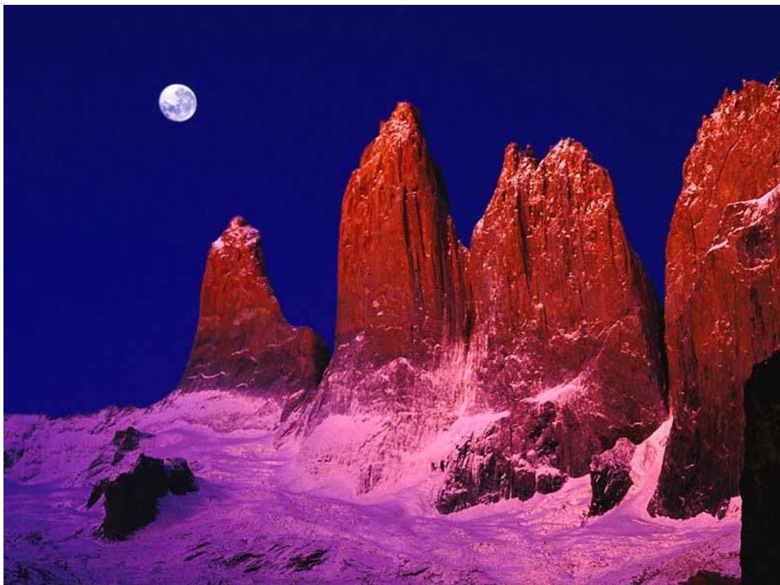
Una spettacolare immagine della Patagonia

Entrambi i candidati delle due maggiori coalizioni che si presenteranno alle presidenziali del 2010, e cioè Eduardo Frei per la coalizione attualmente al Governo e Sebastian Pinnera per la coalizione conservatrice si sono espressi a favore del progetto. Contrario invece il candidato indipendente Marco Enriquez-Ominami .