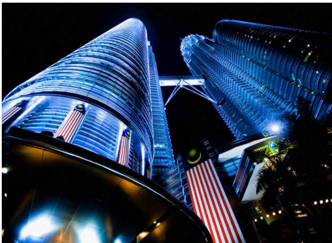
Kuala Lumpur - le Petronas Towers