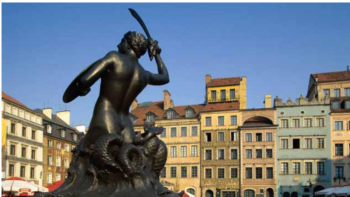
Varsavia; la sirena simbolo della città