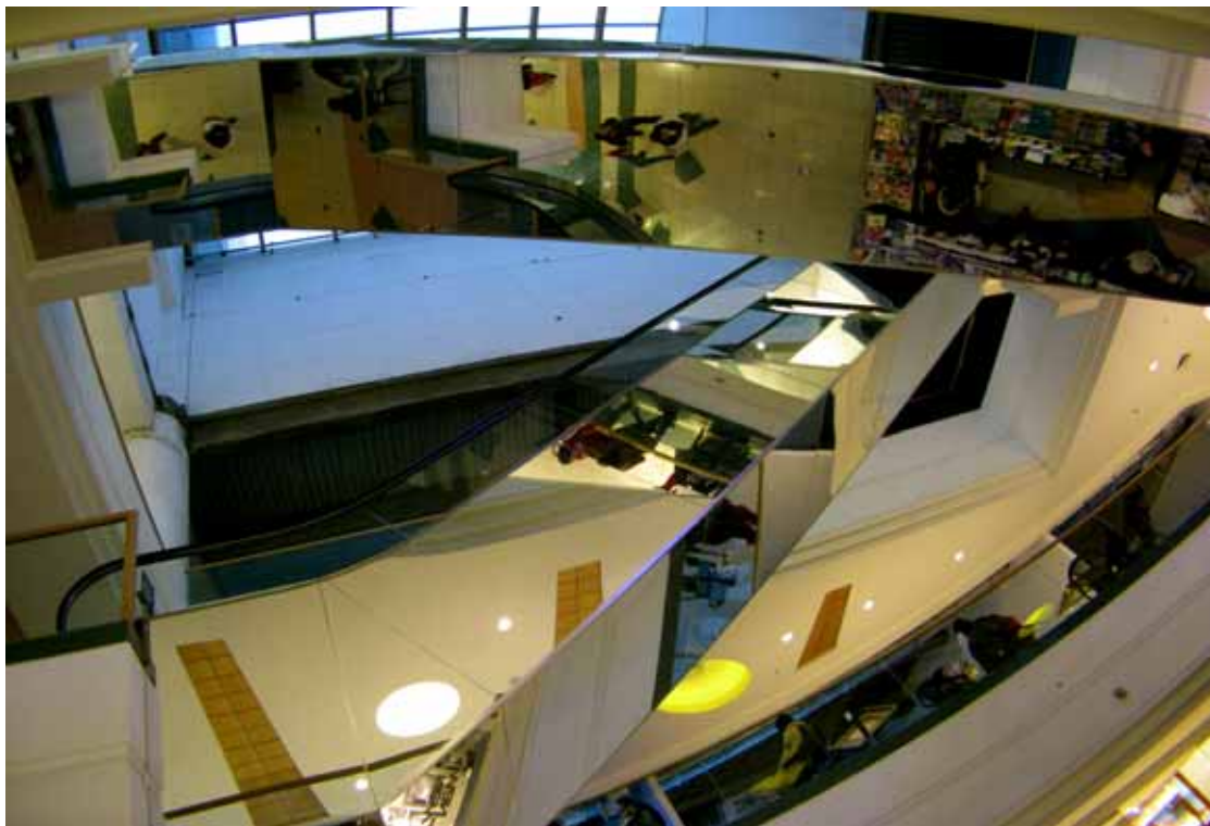
Puerto Montt , uno shopping center

Medesimi accordi sono in corso di ratifica con Bolivia, Brasile, Colombia, El Salvador, Panama e Repubblica Dominicana.