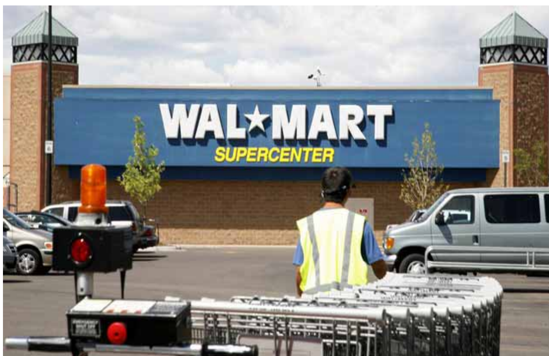
Un supermercato della catena Wal Mart

Con investimenti superiori a 20 milioni di dollari figurano Telex , nel settore delle comunicazioni e la francese Danone , nel comparto alimentare. Tra i dati non figurano gli investimenti inferiori ai 5 milioni di dollari la cui approvazione fa capo ad una procedura semplificata, gestita dalla Banca Centrale . ▶▶