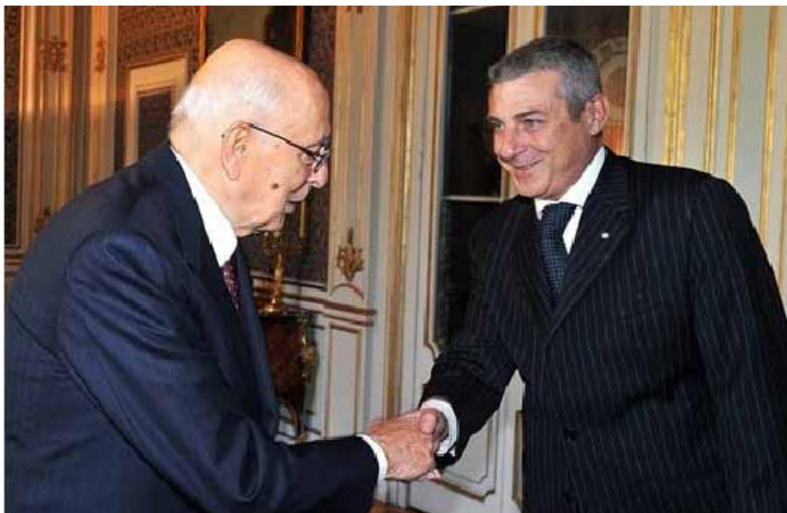
Roma - Il Presidente Giorgio Napolitano con Vincenzo Palladino, nuovo Ambasciatore d'Italia a Santiago del Cile

Questo Paese interessa non solo per il suo mercato, ma in quanto vera e propria piattaforma internazionale, grazie ad una rete di accordi di libero scambio che consentono di raggiungere da qui il 75% del PIL mondiale e oltre 3,5»