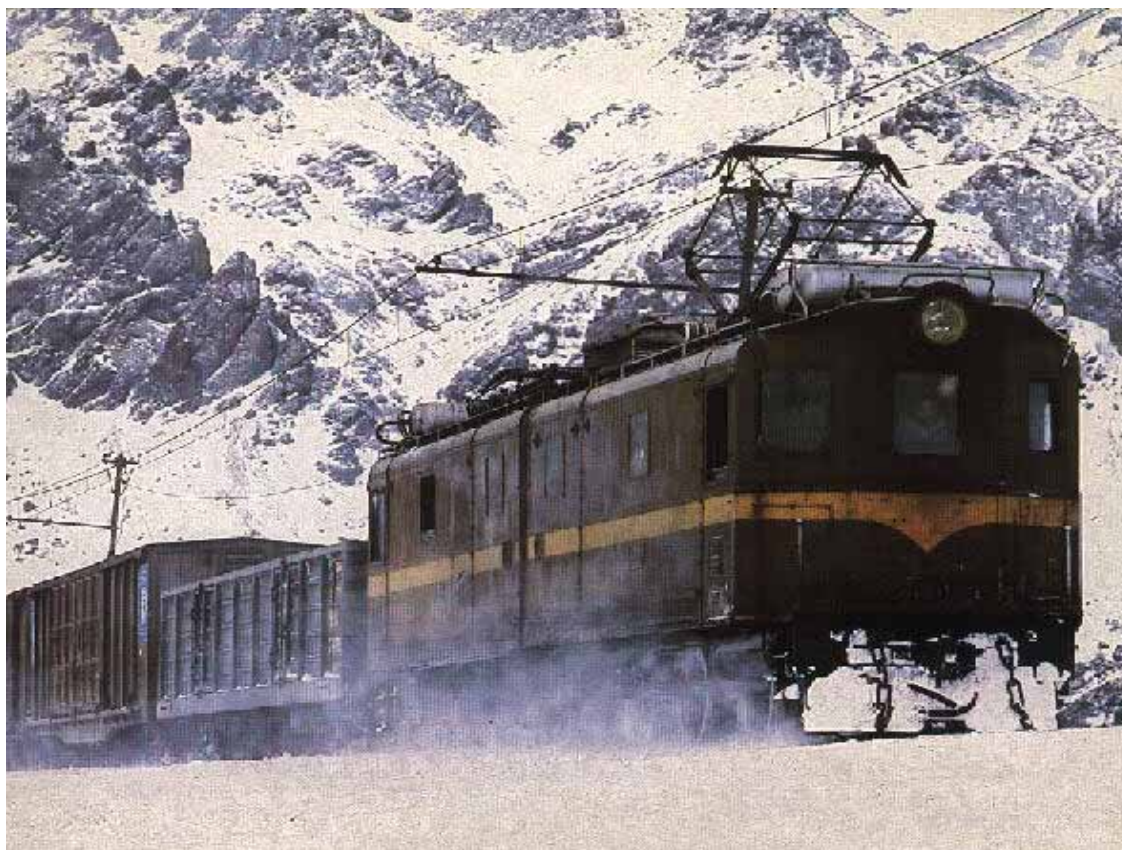
Un convoglio del Ferrocarril Transandino