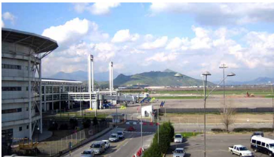
Santiago - L'aeroporto internazionale

Nei prossimi anni, il programma pluriennale di investimenti annunciato dal Ministro per le Opere Pubbliche, Sergio Bitar , prevede la costruzione di nuovi porti e il rinnovamento di quelli esistenti, una nuova rete autostradale, l'ampliamento degli aeroporti esistenti, la ►►