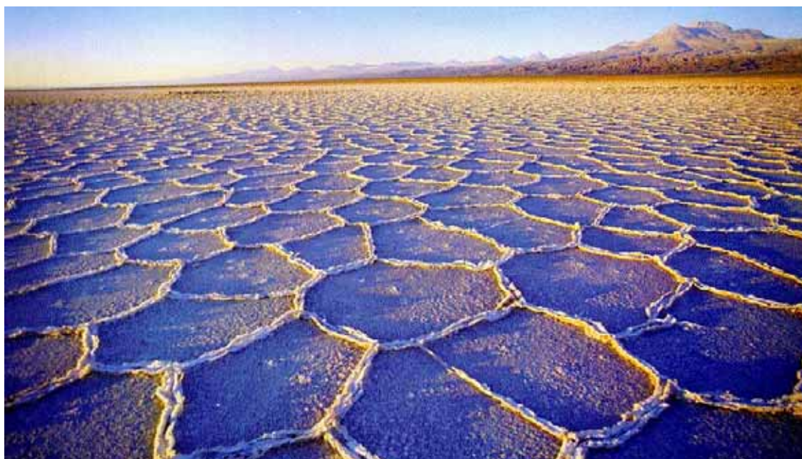
Il deserto di Atacama

Sempre nel deserto di Atacama, a oltre 5mila metri di altezza, è localizzata la piattaforma di osservazione dell' ALMA (Atacama Large Millimeter Submillimeter Array) dove verranno posizionate 66 mega-antenne connesse tra loro per produrre lo stesso effetto di un'unica antenna le cui dimensioni sarebbero tuttavia irrealizzabili. Hanno un diametro di 12 metri ciascuna e un peso (compresa struttura portante, rotori, meccanismi di puntamento e servocontrolli) di 100 tonnellate. Sono in grado di operare perfettamente anche in presenza di venti forti e temperature ostili. Attualmente sono installate e operative due antenne e si calcola che occorreranno circa 10 anni per completare l'intero 'parco'. La base operativa dell'osservatorio e i sistemi di calcolo sono localizzati più in basso, a 2.500 metri di altezza. La gestione fa capo ad un'organizzazione ( JAO : Joint Alma Observatory) di cui fanno parte il principale ente astronomico europeo ( ESO ), statunitense ( NRAO ) e giapponese ( NAOJ ). Il Cile, assieme ad altre aree in Argentina, Antartide, Marocco e Sudafrica è anche una delle possibili localizzazioni per l'installazione del prossimo European Extremely Large Telescope (E-ELT) dell'ESO, con un diametro dello specchio primario di 42 metri. ■