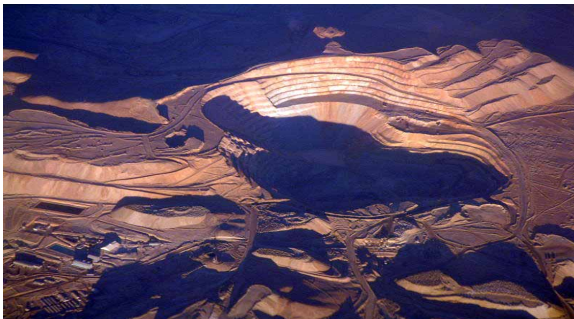
Chuquibambilla - La miniera a pozzo aperto di Chuquibambilla, sebbene non sia la più grande, vanta la maggior estrazione di rame al mondo. La miniera arriva a una profondità di 850 metri

Il Cile, attraverso il perseguimento di politiche di liberalizzazione del commercio internazionale e degli investimenti, si presenta agli imprenditori stranieri come piattaforma di investimenti e diservizi. In particolare, a livello mondiale, è lo Stato che ha concluso il maggior numero di accordi di libero scambio e il 75% di export-import avviene attraverso tariffe preferenziali. In ambito multilaterale è membro della WTO (World Trade Organization) dell'APEC (Comunità Economica dell'Asia Pacifico) ed è associato al Mercosur (Mercato Comune Brasile, Argentina, Paraguay e Uruguay). Partecipa ai negoziati ALCA (Área de Libre Comercio de las Américas) e ALADI (Associação Latino-Americana de Integração,) ed è diventato il primo membro sudamericano dell'OCSE. »