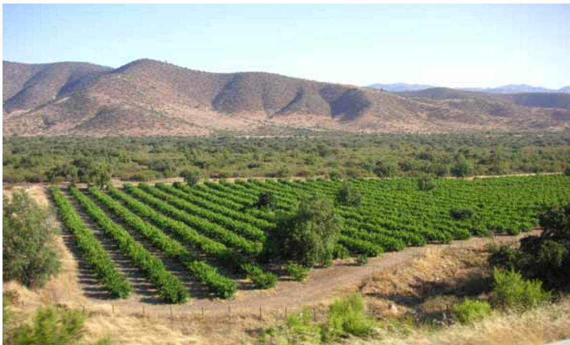
Molti dei vigneti cileni si trovano ai piedi delle Ande

Infine, il mercato interno cileno soprattutto, attraverso i canali della grande distribuzione , offre un interessante sbocco all'offerta made in Italy di pasta, caffè, dolci, salse, confetture. Restano tuttora aperte alcune problematiche relative all'importazione di salumi e formaggi a causa delle rigide norme sanitarie stabilite dal locale servizio di controllo doganale. ▶▶