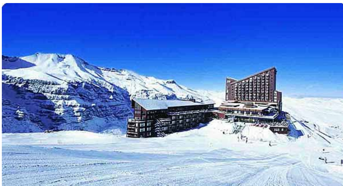
Il Cile sta diventando una meta sempre più popolare anche per gli sport invernali. Nella foto, la località di Valle Nevado , in Patagonia

Turismo L'afflusso di turisti stranieri in Cile supera attualmente il milione di visitatori anno ed è in costante crescita anche perché il potenziale del Paese in questo settore è molto elevato. Il Governo lo ha inserito tra le aree prioritarie di sviluppo. Alcuni segmenti, in particolare, offrono opportunità interessanti per le imprese italiane (forniture impiantistiche, contratti di gestione, joint venture ): sono ad esempio il turismo termale in quanto il Paese conta ben 2.900 vulcani, di cui 80 in attività, e il turismo andino con particolare riguardo allo sci e agli sport invernali in genere. Contatti preliminari in questi settori sono già stati avviati dal gruppo Leitner (impianti di risalita e turismo invernale) e dalle Terme di Montegrotto (turismo termale nell'Araucania).