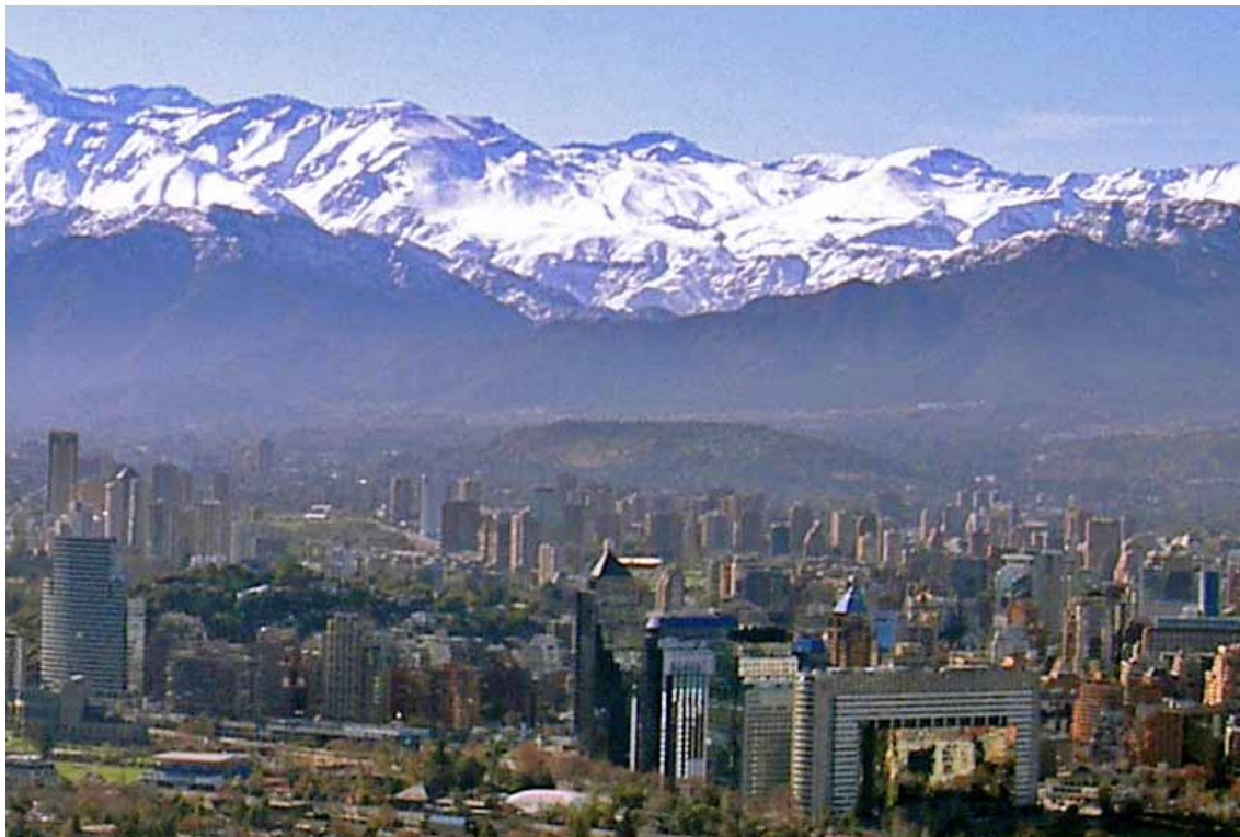
Santiago del Cile - Panorama della città sullo sfondo delle Ande

Il Cile viaggia ad una velocità diversa, e molto più elevata di tutta l'America Latina, con la sola eccezione del Brasile. L'apertura ai mercati mondiali è elevatissima. È difficile per gli altri Paesi latinoamericani confrontarsi con una realtà ►►