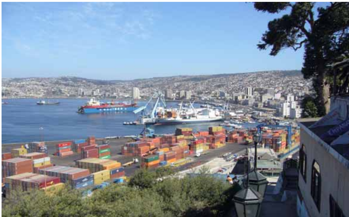
Valparaíso - La città ospita il principale porto del Cile sull'Oceano Pacifico

importazioni di petrolio greggio, carburanti e automobili. In termini di interscambio globale, la Cina è il principale partner commerciale del Cile con 7,7 miliardi di dollari e una quota del 17,7% sull'interscambio totale. Al secondo posto gli Stati Uniti con 7 miliardi, seguiti dal Giappone con 2,8 miliardi. A livello di blocchi regionali, l'Asia continua ad essere il principale partner con una quota del 35% seguita dai Paesi NAFTA (Stati Uniti, Canada e Messico) con il 21%, America Latina (20%) e UE (18%). Tra i Paesi europei l'Italia occupa il quinto posto dietro Germania, Paesi Bassi, Spagna e Francia. ►►