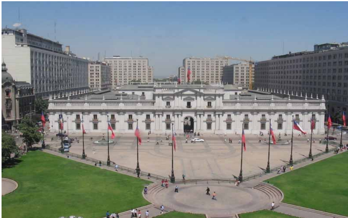
Santiago - Palacio de La Moneda, il Palazzo presidenziale cileno

Un ulteriore importante passo sarà la riapertura del negoziato per il Trattato contro le Doppie Imposizioni , interrotto da Italia, USA, Australia e altri Paesi in attesa di un'accettazione da parte di Santiago dell'articolo 26 della Convenzione OCSE che regola lo scambio di informazioni.