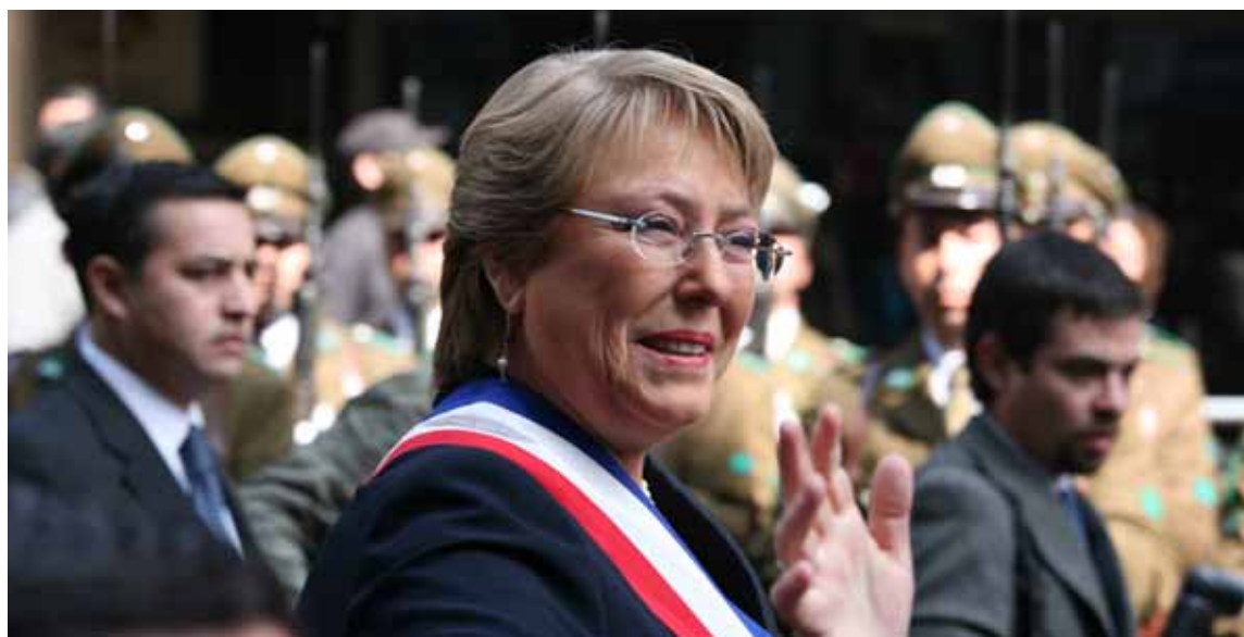
La presidente uscente del Cile, Michelle Bachelet Jeria

vano del Paese da cui sono stati prelevati 4 miliardi di dollari Usa, pari al 2,8% del PIL. L'accumulo di tali fondi è stato possibile grazie all'oculato risparmio nei periodi in cui il prezzo del rame sui mercati internazionali era notevolmente alto. In tal modo, nel 2009, la diminuzione del PIL ha potuto essere contenuta in una forchetta corrispondente all'1,5 -2 per cento. E nel 2010 è prevista una rapida ripresa con una crescita tra il 4,5 ed il 5,5 per cento. Secondo l' Indice di libertà economica elaborato dall' Heritage Foundation e dal Wall Street Journal , il Cile si conferma il Paese con l'economia più libera dell'America Latina e si posiziona all'11esimo posto a livello mondiale. E anche Standard & Poor's ha assegnato al Cile una valutazione di A+ nel rating Paese, posizionandolo quale nazione meno rischiosa della regione latinoamericana.