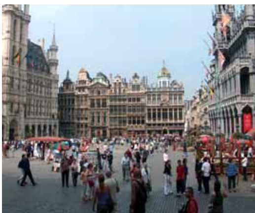
Bruxelles La Grande Place