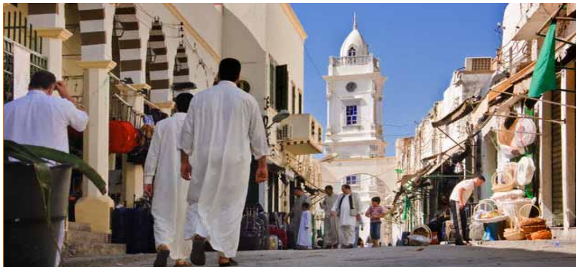
Tripoli, il Souk