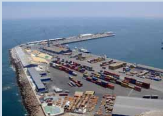
Arica - Il porto

L'iniziativa richiederà un investimento di almeno 3 miliardi di dollari Usa. Lungo tutto il percorso sono previsti centri di scambio intermodali. L'energia necessaria per alimentare la linea sarà assicurata da una centrale idroelettrica in territorio argentino da 300 Megawatt.