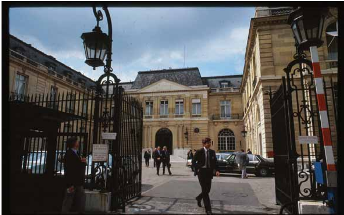
La sede dell'OCSE a Parigi

In un solo anno, il Cile ha saputo modificare il proprio impianto legislativo in materie importanti: trasparenza e corporate governance delle imprese, con l'introduzione della figura dell'Amministratore Delegato, separazione delle responsabilità gestionali delle imprese pubbliche (a partire dal colosso nazionale del rame, Codelco ), affidate al management , da quelle di indirizzo po- ►►