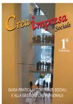
Nella foto: la pubblicazione Creaimpresa Sociale®

Camera di Commercio Italiana, Nice Sophia Antipolis Côte d'Azur