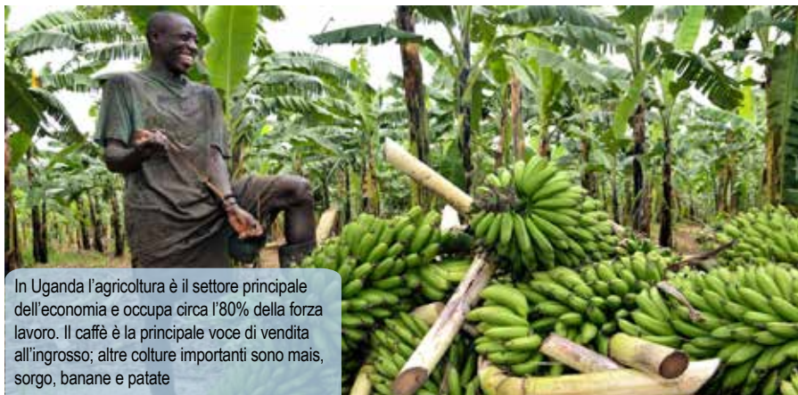
In Uganda l'agricoltura è il settore principale dell'economia e occupa circa l'80% della forza lavoro. Il caffè è la principale voce di vendita all'ingrosso; altre colture importanti sono mais, sorgo, banane e patate

ittico, fiori recisi, coltivazioni biologiche. Diversi investitori, sia locali che stranieri, stanno espandendo una serie di iniziative di agricoltura industriale soprattutto nel settore saccarifero, degli oli vegetali e della floricoltura. Particolarmente attiva nel settore la comunità indiana immigrata nel Paese ormai da diverse generazioni, con alcune imprese che hanno ormai dimensioni consistenti e operano su scala regionale (Kenya, Tanzania, Repubblica Democratica del Congo e così via).