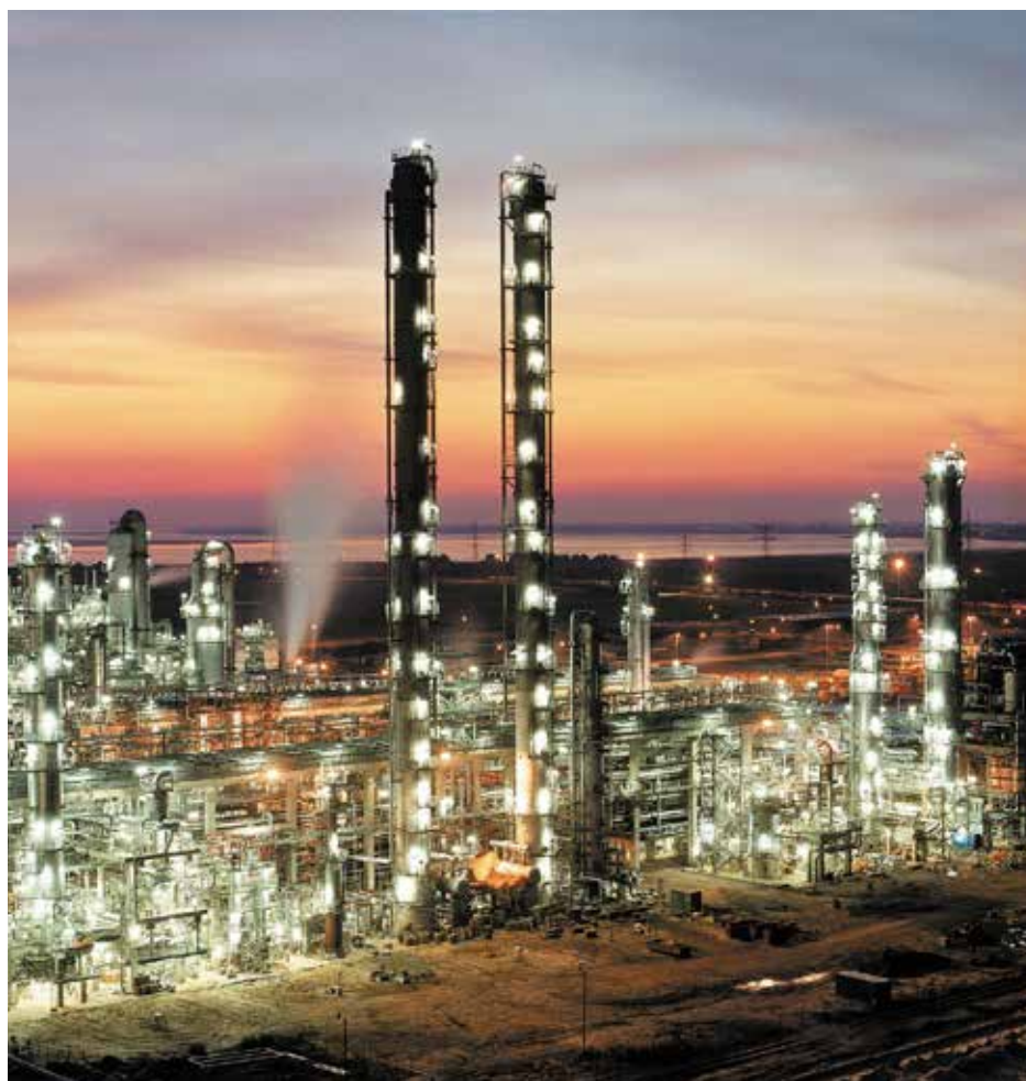
Un impianto petrolchimico

R ipartono numerosi progetti per la produzione di polietilene, polipropilene e aromatici a partire da gas e petrolio che erano rimasti in fase di stand by a causa della instabilità politica del Paese. Gli impianti saranno localizzati ad al Ain Sokhna sul Mar Rosso e nei pressi di Alessandria. Tra le aziende coinvolte, l'italiana Maire Tecnimont.