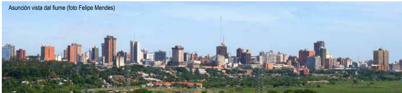
Asunción vista dal fiume

tempi logistici. Il Paraguay non ha sbocchi al mare e quindi gli approvvigionamenti di materiali e componenti è più complesso. Anche perché le infrastrutture di trasporto non sono di altissimo livello.