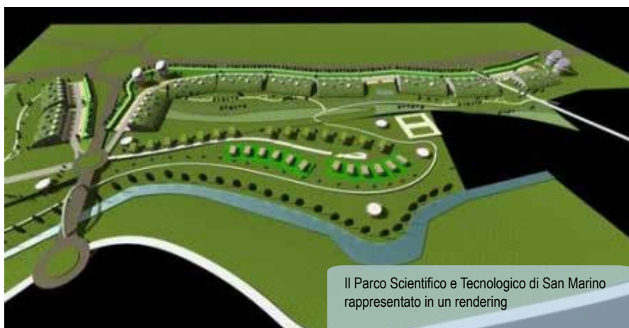
Il Parco Scientifico e Tecnologico di San Marino rappresentato in un rendering

Il Parco sorgerà nella zona industriale di Rovereta, nelle immediate vicinanze del confine con l'Italia. La prima struttura del Parco è un incubatore d'impresa che dovrebbe accogliere 6/10 iniziative. Il bando per la partecipazione è già stato pubblicato e le richieste pervenute saranno sele-