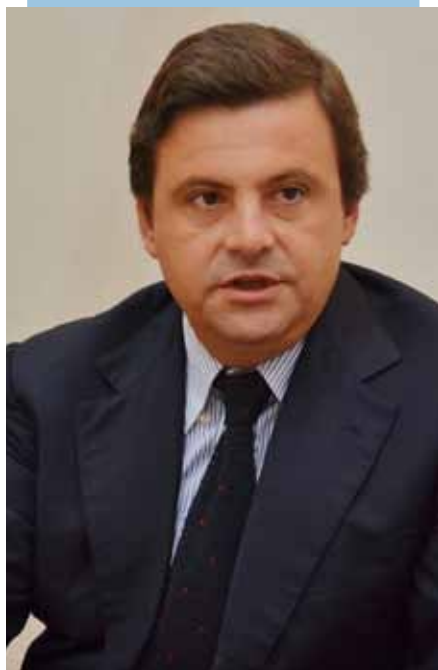
Il Vice Ministro dello Sviluppo Economico Carlo Calenda