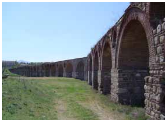
L'antico acquedotto romano di Skopje