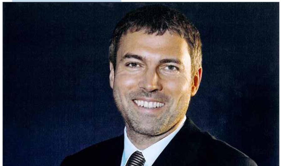
Il finanziere Petr Kellner

estendere le rispettive attività nel settore del gas e dell'energia in Centro Europa. Nei mesi successivi si sono svolte diverse trattative tra EPH e lo Stato con l'obiettivo di uno 'spacchettamento' del controllo di SPP che dovrebbe avvenire nei termini seguenti. Lo Stato manterrà il pieno controllo dell'attività di distribuzione del gas alle piccole utenze, attualmente poco redditizia in quanto le tariffe sono controllate