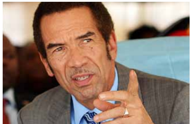
Il presidente del Botswana Ian Khama

oltre il 10% per cento al finanziamento dell'istruzione: dieci anni di scuola dell'obbligo gratuita e 50% degli studenti che completano il ciclo con un diploma di scuola secondaria superiore. Insomma: un patrimonio di risorse umane con una consistente preparazione di base rispetto agli standard africani, ma sempre a costi contenuti. Ora il Governo di Gaborone vuole mettere a profitto gli investimenti effettuati per promuovere una maggiore diversificazione dell'economia. Questo è stato il messaggio del presidente e primo ministro Ian Khama in occasione del tradizionale incontro con il Corpo Diplomatico straniero accompagnato