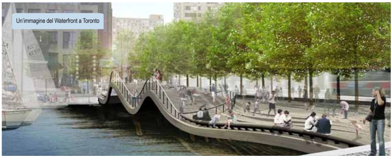
Un'immagine del Waterfront a Toronto

http://www.ambottawa.esteri.it/Ambasciata_Ottawa/Archivio_News/Missione_Imprenditoriale