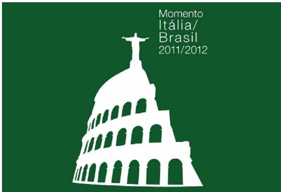
Il logo dell'iniziativa