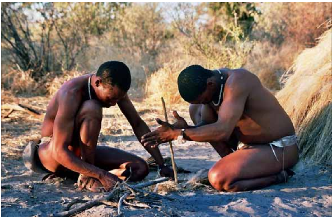
Boscimani del Botswana

GABON: diminuzione della dotazione finanziaria di 9,8 milioni di euro. Le detrazioni saranno così ripartite: 1 milione di euro nei settori dell'acqua e servizi igienici, stradale e governance settoriale. 4,8 milioni di euro nel settore della "Educazione e Formazione". 4 milioni di euro negli altri settori non prioritari. È stato ap- ➤