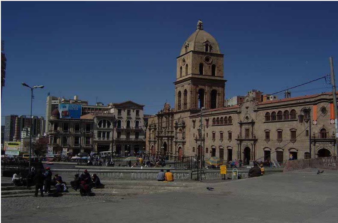
La Paz - Piazza San Francisco

Per iscrivervi a questa newsletter compilate il modulo all'indirizzo www.esteri.it/MAE/IT/Ministero/Servizi/Imprese/ DiplomaziaEconomica/Newsletter/