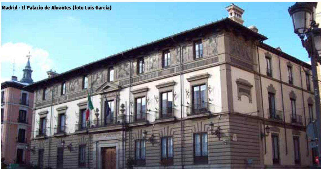
Madrid - Il Palacio de Abrantes