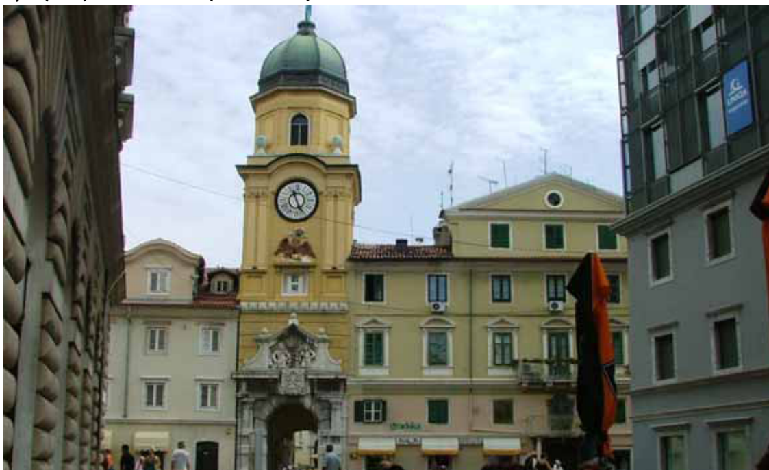
Rijeka (Fiume) - Una via del centro