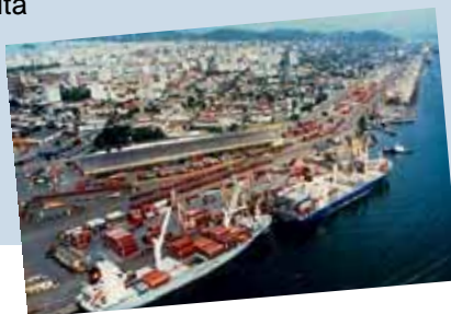
Il terminal dello zucchero nel Porto di Santos

- Una dichiarazione di intenti tra la Regione Marche , la FIESP e la Confederazione nazionale dell'Industria per ricercare ulteriori forme di collaborazione per la creazione e la valorizzazione di distretti industriali di PMI.