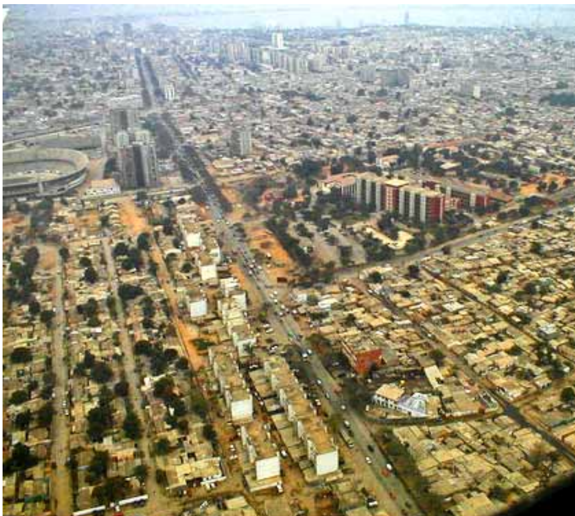
Luanda - Veduta aerea