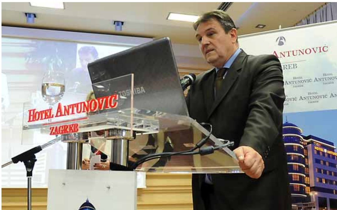
Il Vice Primo Ministro e Ministro dell'Economia Radimir Cacic

Il Governo si sta muovendo su più fronti: semplificazione normativa, alleggerimento fiscale a carico per le imprese, elabora- ➤