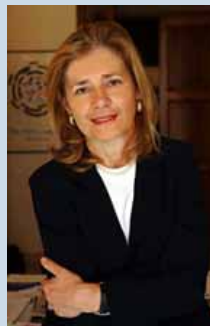
Il Sottosegretario agli Esteri, Marta Dassù

Nel settore auto, sono stati visitati gli stabilimenti Fiat e Volkswagen e per l'aerospaziale, il sito Embraer e il Parco tecnologico di Campinas. Le circa 250 imprese italiane che hanno partecipato alla missione, selezionate su un paniere di circa 700, hanno preso parte a circa 1500 incontri business to business con aziende interessate a proposte di cooperazione economica e/o commerciale con controparti italiane. Ci sono stati anche incontri con le principali organizzazioni imprenditoriali brasiliane tra cui la Federazione dell'Industria dello Stato di San Paolo ( FIESP ) e di quello di Paraná. La FIESP, in particolare, ha ospitato il Forum di apertura delle missioni. Il Sottosegretario Dassù ha il-