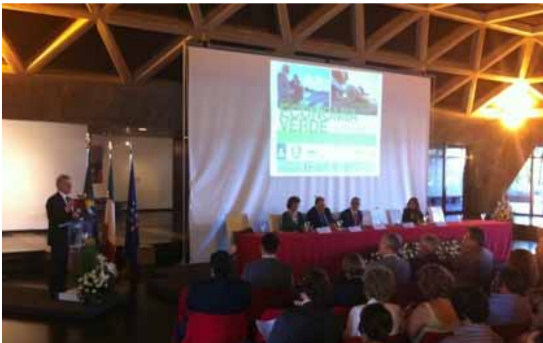
Un momento dell'incontro "Economia Verde e Rio +20"