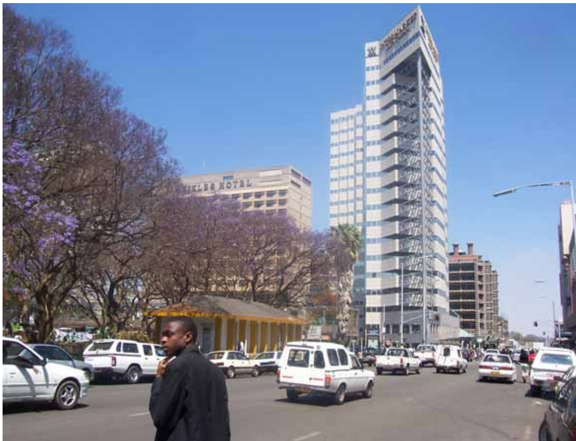
Harare (Zimbabwe) - Una strada del centro