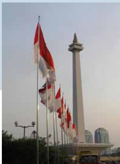
Il Monumento Nazionale (Monas)