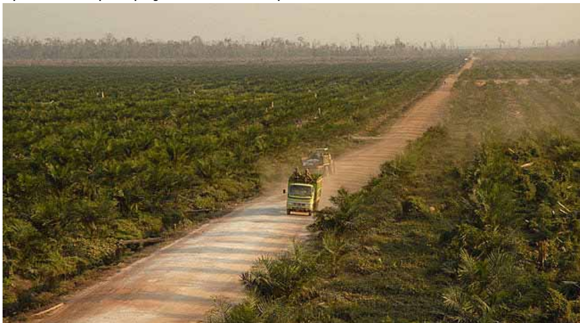
Un camion attraversa una piantagione di palme da olio nella provincia del Kalimantan Centrale. Negli ultimi 10 anni, in Indonesia la superficie dedicata a questa tipologia di coltivazione è circa triplicata

stante crescita (+ 10% annuo), è importatore netto in questo settore. Di grande rilevanza anche le riserve e l'estrazione di bauxite, il minerale di base per la produzione di alluminio. Gli interventi programmati mirano a sviluppare l'intero settore "downstream" con nuovi impianti per la produzione di allumina, alluminio primario e semilavorati e investimenti previsti pari a 13 miliardi di dollari. Da rilevare il forte interesse per il settore espresso da investitori indiani e dei Paesi del Golfo. Nel campo dell'olio di palma la situazione è analoga a quella di Sumatra con la differenza che i recuperi di produttività possibili con un miglioramento delle tecniche colturali e delle infrastrutture di trasporto del prodotto, sono ancora superiori (attorno al 47%). Infine le foreste: le aree coinvolte ammontano a 42 milioni di ettari di cui solo 15 milioni sono sfruttate come foreste coltivate. Anche questo settore, monopolizzato, sotto il profilo commerciale da un numero limitato di operatori, è aperto ad ampi spazi di razionalizzazione sia sotto il profilo delle politiche forestali, che degli interventi infrastrutturali per il trasporto dei materiali. Kalimantan, infatti, ancora più di Sumatra per la sua stessa configurazione geografica ha bisogno di nuove strade e di ferrovie. Gli investimenti previsti in questi due settori sono considerevoli: ammontano complessivamente a quasi 6 miliardi di dollari.