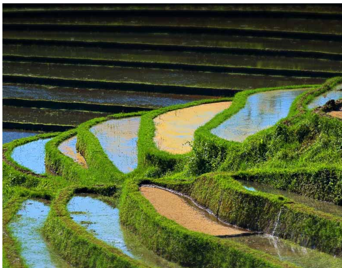
Bali - Risaie a terrazza

Il Governo di Jakarta ha avviato un ambizioso piano di sviluppo che consentirà di valorizzare le immense risorse agricole, minerarie ed energetiche del Paese