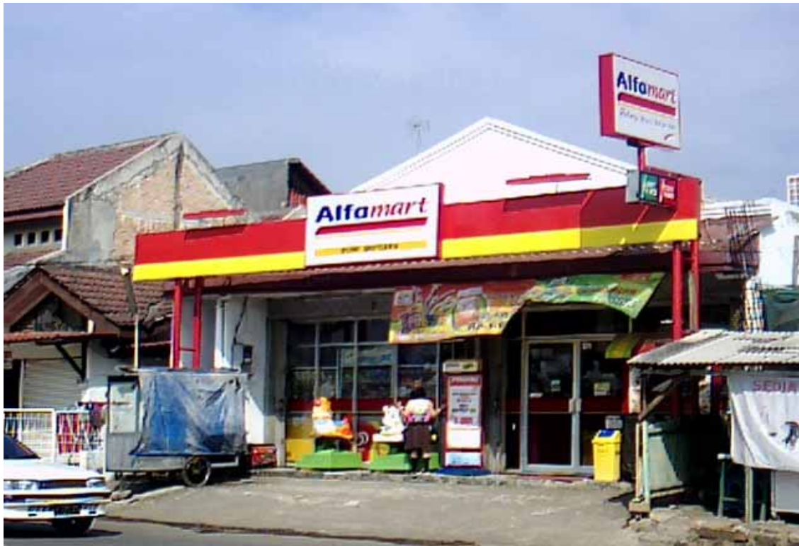
Un minimarket della catena Alfamart