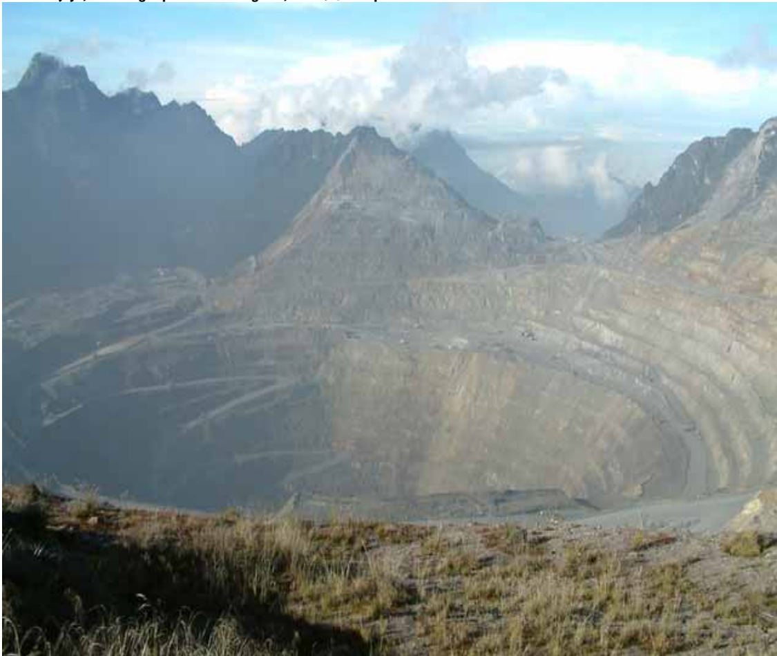
La Grasberg Mine è la più grande miniera d'oro e la terza più grande miniera di rame della Terra. Si trova nella provincia di Papua, vicino al Puncak Jaya, la montagna più alta della regione, e ha 19.500 dipendenti

no ha solide basi economiche. Il vero ostacolo, più che nel reperimento dei capitali, risiede in realtà nella necessità di attuare un'opera di snellimento e razionalizzazione di strutture e procedure amministrative e burocratiche che corrispondono a logiche di potere e di controllo ereditate dal passato. E che hanno contribuito, finora, a rallentare i processi autorizzativi di numerose iniziative. Si aggiunge la necessità di trovare soluzioni socialmente sostenibili per l'attuazione di interventi che possono avere un impatto negativo sull'assetto del territorio e di chi vi abita. È il caso ad esempio di molti progetti in campo minerario. In sostanza, efficienza e trasparenza amministrativa da un lato, e sostenibilità sociale dall'altro, sono i due estremi di quella che si prospetta come una silenziosa rivoluzione culturale. Dai tempi e modi con cui procederà questo cambiamento, dipende l'assetto futuro del Paese. ▶▶