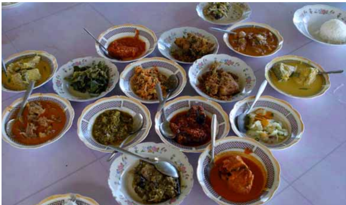
I classici intingoli indonesiani che vengono serviti con il riso

to delle produzioni alimentari nascono da un duplice movimento: l'aumento dei redditi nel Paese e quindi della spesa alimentare della popolazione e la visibile insufficienza di un'adeguata offerta locale di prodotti: nei supermercati indonesiani si trovano acque minerali, succhi di frutta e prodotti al cioccolato importati (anche dall'Italia). Ed è un paradosso in un Paese che non manca certo di fonti di acqua, produzioni frutticole e che è anche il primo produttore mondiale di polvere di cacao. Paradosso che il Governo indonesiano ha peraltro identificato e che si propone di superare con il Piano pluriennale di sviluppo avviato nel 2011 in cui sono identificate le aree dove concentrare lo sviluppo dell'industria alimentare, dotandole delle necessarie infrastrutture: strade, centri di stoccaggio, industrie trasformatrici, porti e collegamenti per un rapido invio dei prodotti. Tradotto in termini di potenzialità di mercato per le aziende italiane, l'intero scenario propone un ampio spazio per la fornitura di catene del freddo, macchine per imbottigliamento e packaging, impianti per panificazioni, prodotti da forno e paste alimentari il cui consumo in Indonesia è in costante crescita con 'noodles' e altri formati a base di grano ma anche tapioca, riso e altri cereali spesso in abbinamento con spezie che caratterizzano il prodotto. ■