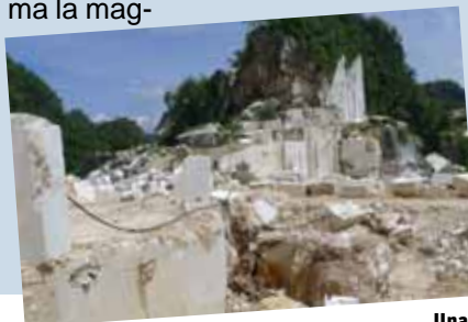
Una cava di marmo a Maros, nel sud di Sulawesi