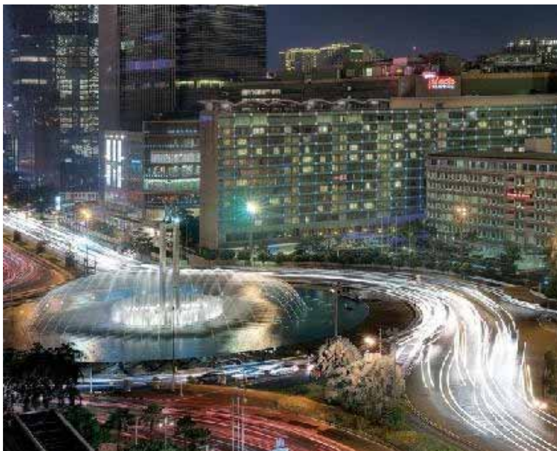
Jakarta - Una strada del centro

Leggi gli aggiornamenti su www.notiziariofarnesina.ilsole24ore.com