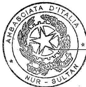
L'Ambasciatore Marco ALBERTI

“L'originale dell'atto è depositato presso l'Ambasciata d'Italia in Kazakistan” Pubblicato sul sito istituzionale dell'Ambasciata d'Italia in Kazakistan ( www.ambastana.esteri.it ) nella sezione Amministrazione Trasparente alla pagina Bandi di gara e contratti ex art. 37 - 2022.