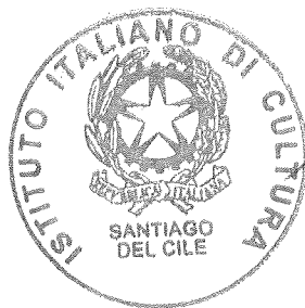
Mauro Battocchi Mauro Battocchi Embajador de Italia