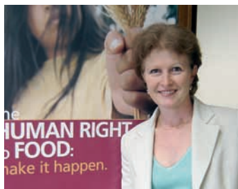
Foto: Barbara Ekwall Coordinatrice Right to Food Unit – Divisione ESA

Nel 2004 un Gruppo di Lavoro Intergovernativo (IGWG), formato da molti Paesi del Consiglio della FAO, ha adottato un testo di “Direttive Volontarie” non vincolanti sulla progressiva realizzazione del diritto ad un'alimentazione adeguata nel contesto della sicurezza alimentare nazionale”. Queste sono state elaborate con la finalità di combattere la fame e la malnutrizione utilizzando un approccio basato sui diritti umani. Il diritto all'alimentazione venne inserito tra le nove priorità della FAO, e allo stesso tempo il Consiglio decise che sarebbe stata necessaria un'opportuna ed adeguata diffusione del testo approvato, mediante la preparazione di informazioni, comunicazioni e materiale didattico, così come mediante la sensibilizzazione di governi e comunità locali.