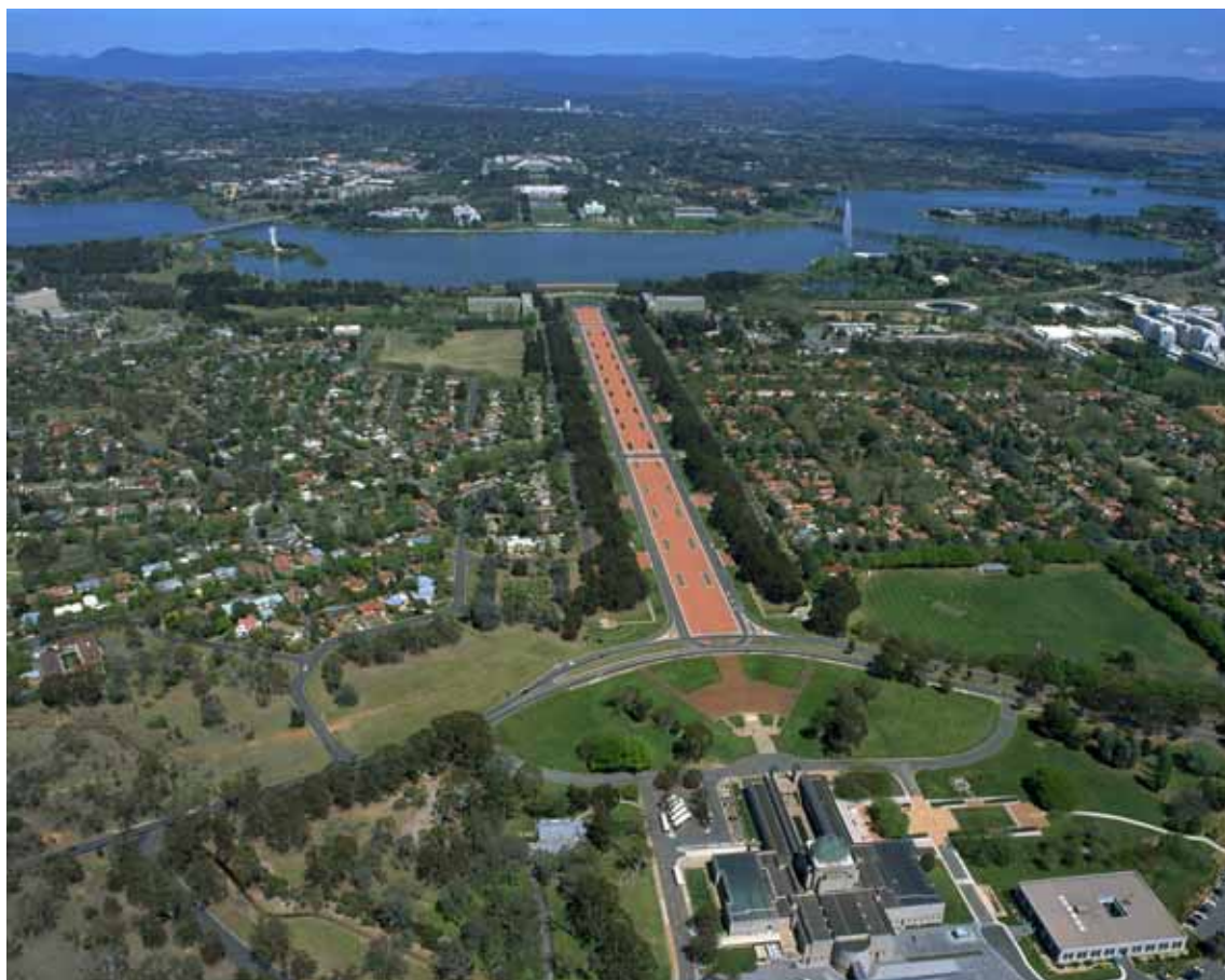
Canberra - Veduta aerea

torale a riportare il bilancio in surplus in tempi brevi. Quest'anno i conti dello Stato chiuderanno ancora con un deficit pari al 1,5% del Pil (22,6 miliardi di dollari australiani), ma già nel 2012/2013 torneranno in attivo per un ammontare pari allo 0,2% del PIL (3,5 miliardi) per poi crescere gradualmente. Il debito netto pubblico si attesterà invece al 7,2% del Pil nel 2011-12. Il rientro del deficit di bilancio sarà reso possibile dai proventi della crescita economica e dal contenimento della spesa pubblica, con tagli consistenti alla spesa sociale (2 miliardi) che colpiranno soprattutto le famiglie con reddito medio-alto, e alla difesa (circa 4,3 miliardi in 5 anni).