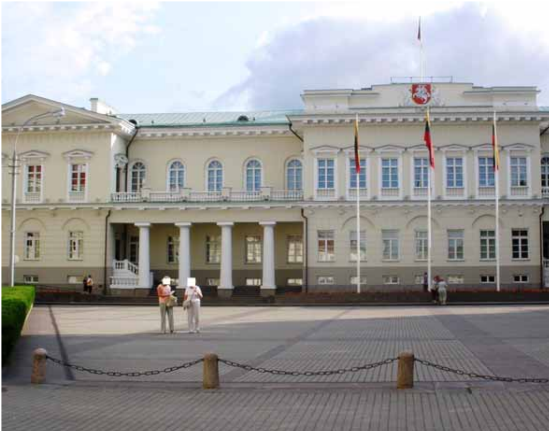
Vilnius - Il Palazzo Presidenziale

Il debito pubblico è passato dal 29,5% del Pil nel 2009 al 38,2% nel 2010. È in corso il dibattito politico e parlamentare sull'introduzione della tassazione progressiva. Al momento, l'aliquota dell'imposta sul reddito delle persone fisiche è del 15%. Il nuovo Ministro dell'Economia, Rimantas Zylius punta molto anche sullo sviluppo di un contesto "business friendly". In quest'ottica, l'azione di governo sarà orientata alla riduzione degli oneri amministrativi per le imprese. L'obiettivo è convertire la Lituania in un " Nordic Baltic Service Hub " entro il 2015 e in un " Innovation Hub " per il 2020. ▶