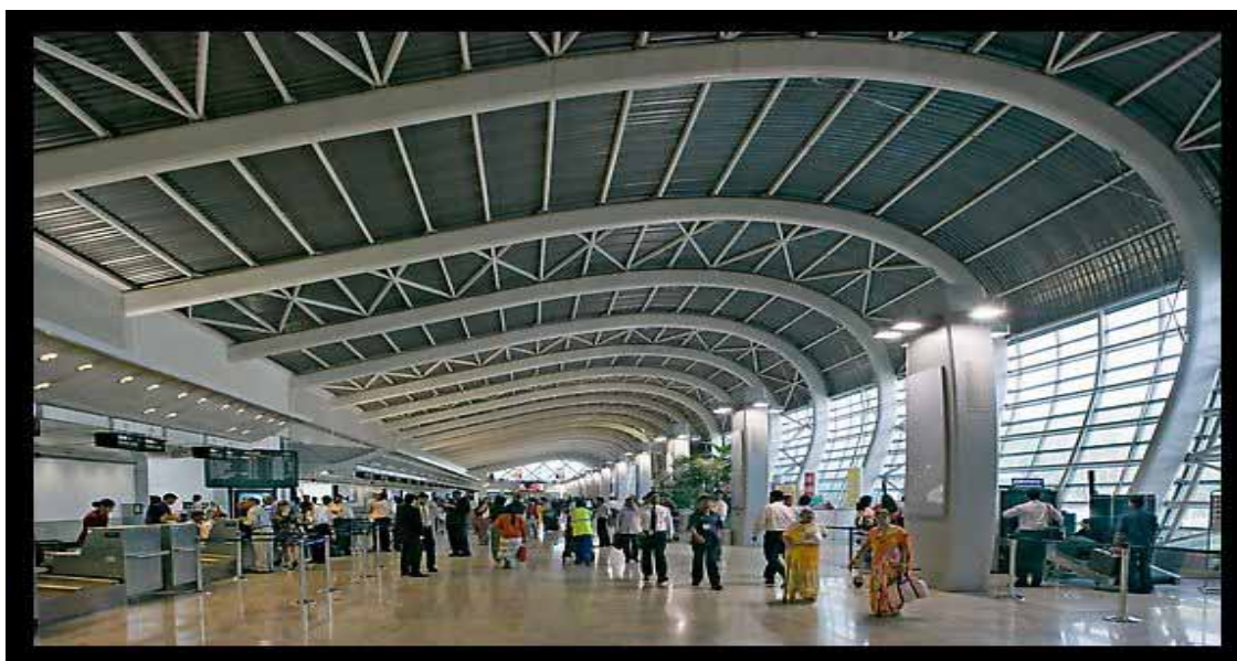
Mumbai - L'aeroporto