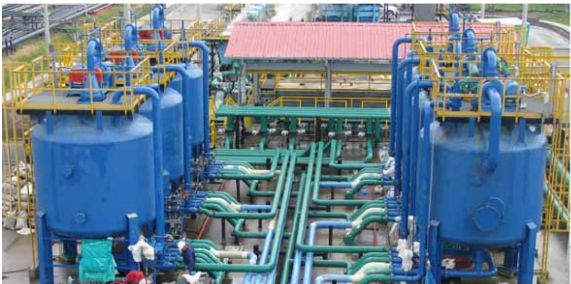
Il campo petrolifero di Rubiales