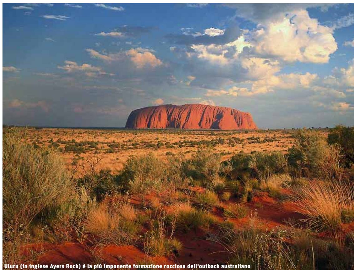
Uluru (in inglese Ayers Rock) è la più imponente formazione rocciosa dell'outback australiano