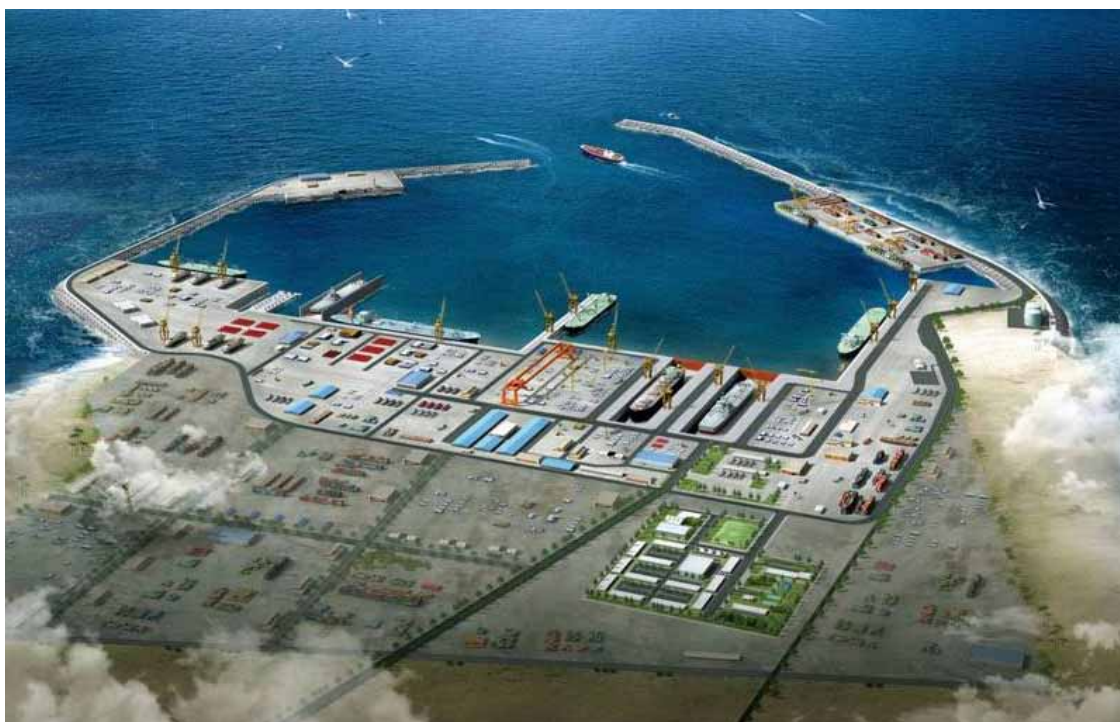
Duqm - Veduta aerea del polo marittimo