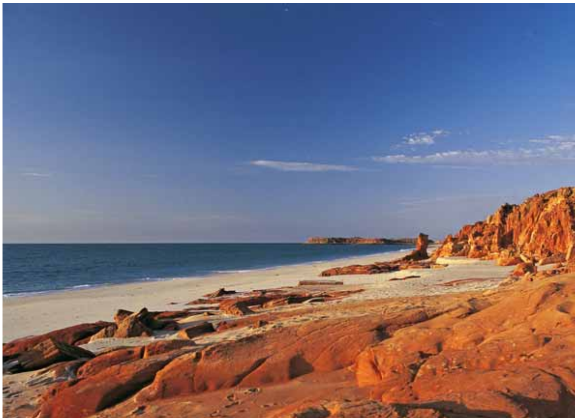
Cape Boulder (Western Australia)