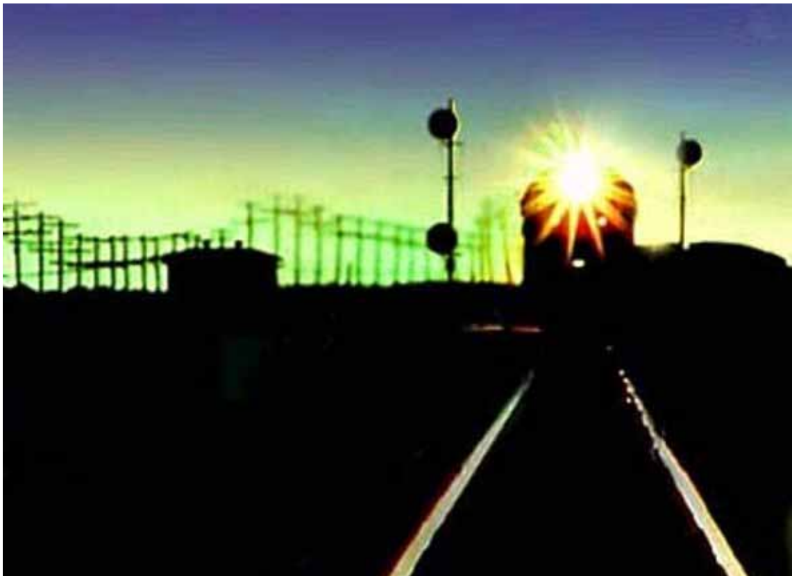
L'Adelaide Rail Freight

Previsto l'incremento dei fondi per l'agenzia Infrastructure Australia , che ha il compito di definire la politica infrastrutturale del Paese che sarà messa nelle condizioni di poter rafforzare la propria indipendenza operativa. Ci saranno anche incentivi fiscali per attrarre capitali stranieri e investimenti privati nei Progetti infrastrutturali identificati come prioritari dalla stessa Agenzia. È confermato anche l'impegno a reinvestire 6 miliardi dei proventi della Minerals Resource Rent Tax (MRRT) per la realizzazione di infrastrutture a sostegno dell'industria mineraria. ►►