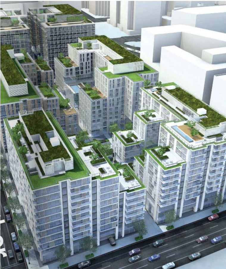
Un rendering Del CityCenterDC