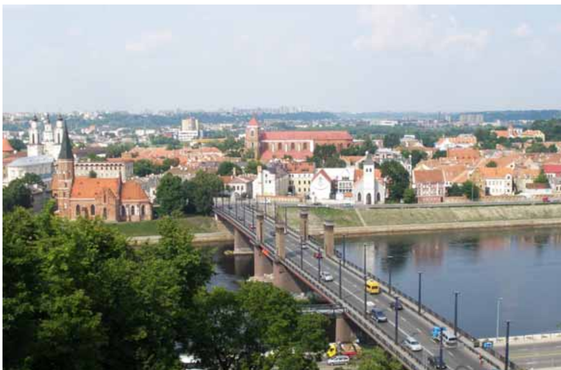
Kaunas - Panorama. La città è la seconda della Lituania per abitanti ed è il principale centro industriale del Paese