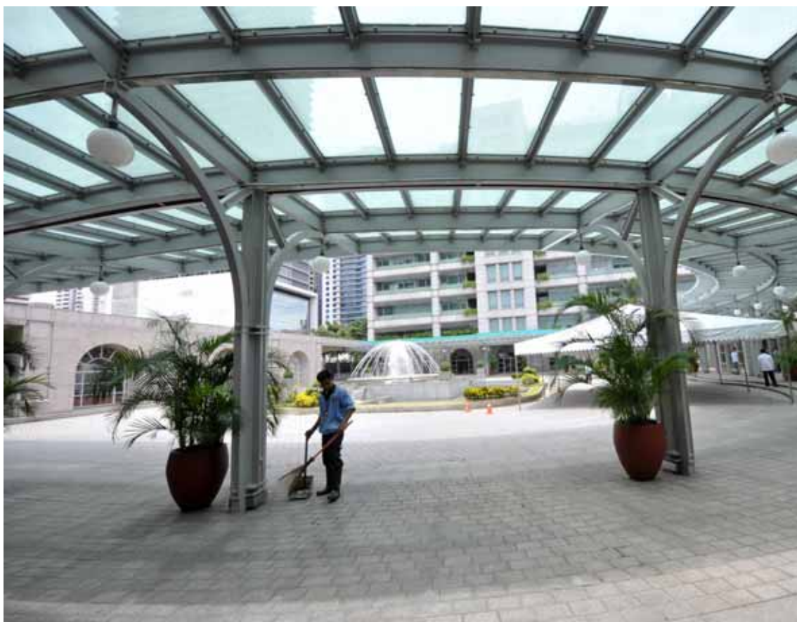
La sede dell'Asian Development Bank a Manila