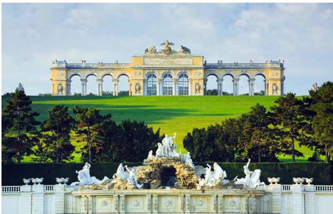
Vienna - La Fontana di Nettuno allo Schloss Schoenbrunn