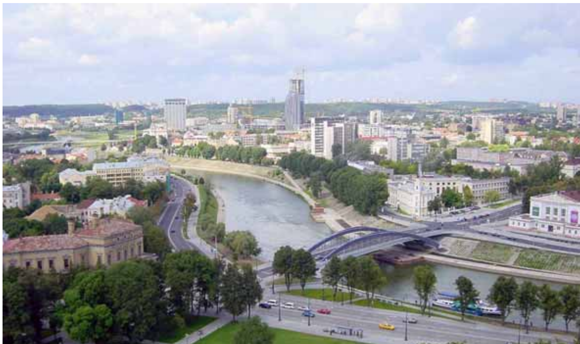
Vilnius - Panorama della città

Apranga AB , la più grande catena di ab- ➤