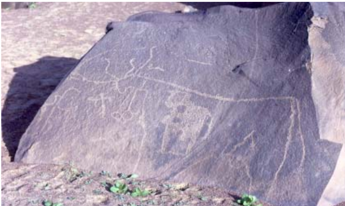
Mauritania - Un'incisione rupestre. Dalle tematiche dei reperti si evince che la Mauritania non è sempre stata una regione desertica, ma fertile e ricca d'acqua. Il ritrovamento di ciottoli lavorati su due lati testimonia la presenza dell'uomo sin dal Paleolitico inferiore. Le popolazioni berbere, fondendosi progressivamente con quelle autoctone diedero origine ai Mauri.

Oggi l'Italia è già presente nel Paese soprattutto con attività legate all'industria della pesca, con particolare riguardo ai cefalopodi e ai crostacei. "Il settore è regolamentato da un accordo ►►