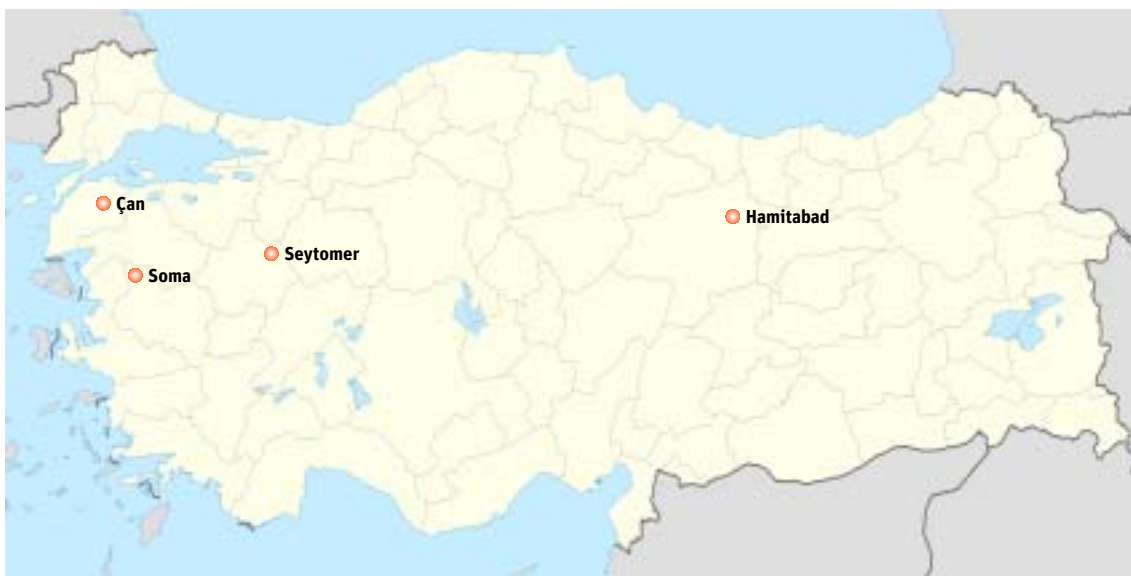
Turchia - la localizzazione delle centrali termoelettriche in cessione

OIB ha anche affrontato i problemi finanziari collegati al programma di cessione, con una tournée preliminare di incontri con diverse banche turche. ►►