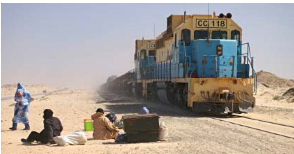
Un treno della Snim alla stazione di Nohuadhibou

La Mauritania ha una superficie molto estesa: oltre un milione di chilometri quadrati con un interno prevalentemente desertico, tranne le aree che costeggiano i corsi d'acqua, tra cui il grande fiume Senegal. ➤