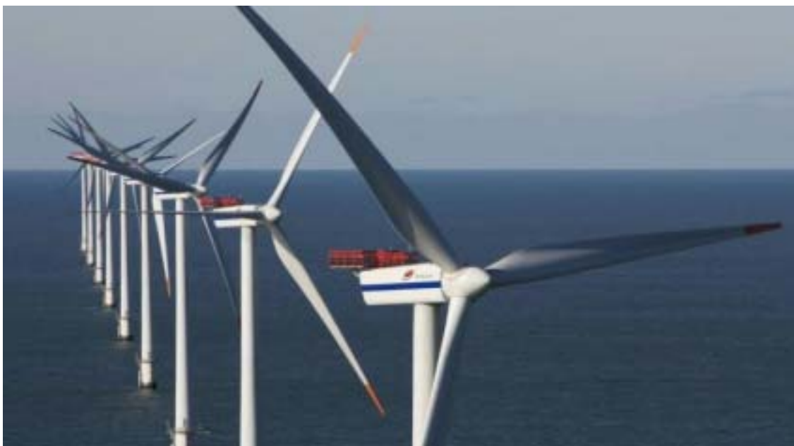
Un parco eolico offshore