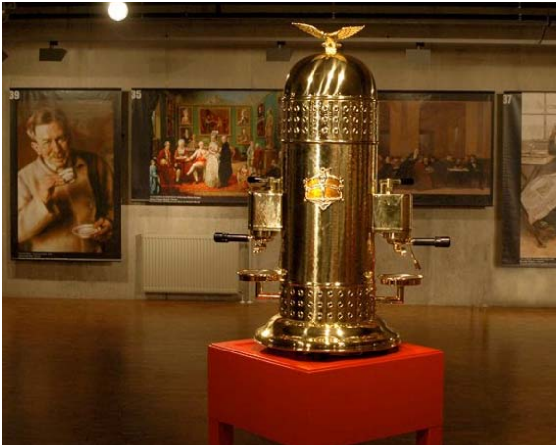
Shanghai - La mostra dedicata al caffè - In primo piano una macchina "Arduino"