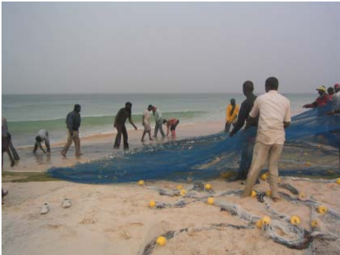
Pescatori a Nouakchott

Per ulteriori informazioni sulle opportunità di investimento in Mauritania, l'Ente di riferimento è il Centre pour la promotion des Investissements , con un sito in francese, spagnolo e inglese. ■