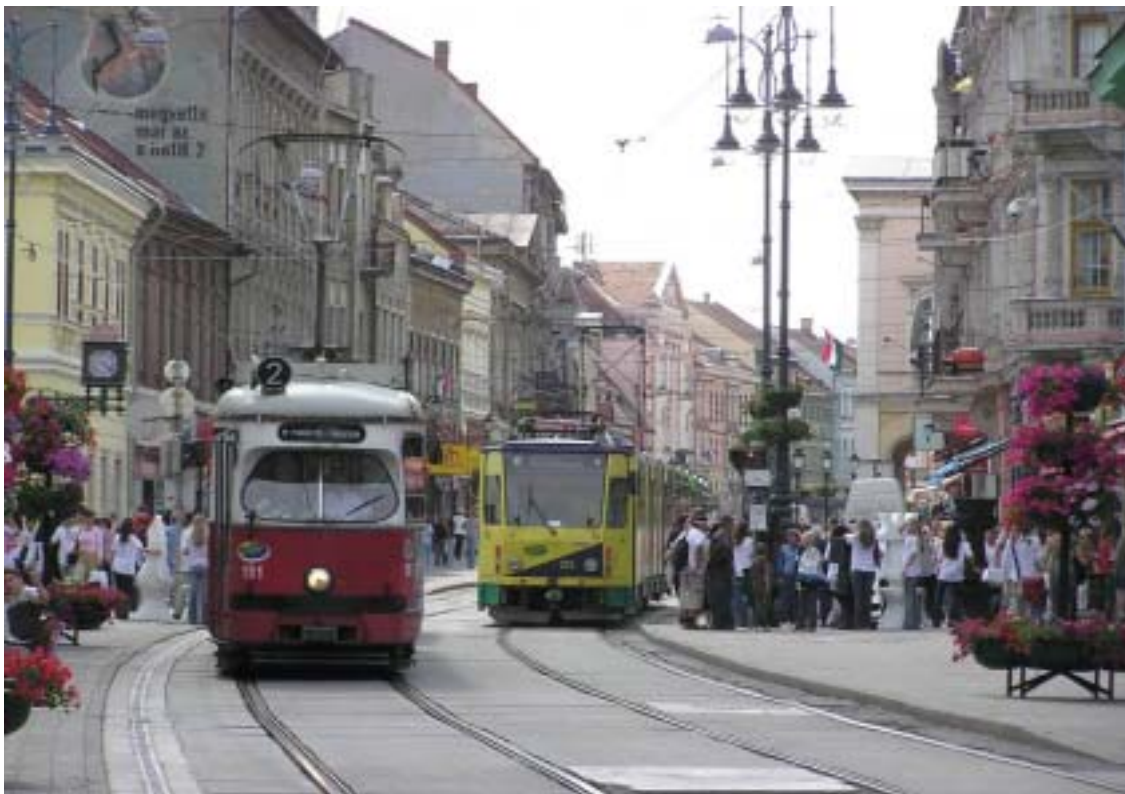
Miskolc (Ungheria) - Due tram sulla Széchenyi