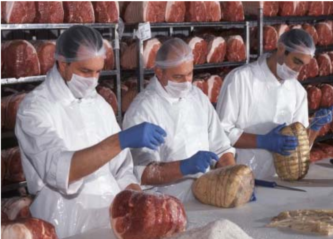
La lavorazione dei culatelli

L'altro versante della sfida - ma questo vale per l'Africa intera, non per Cremonini - è l'allevamento su larga scala. ➤