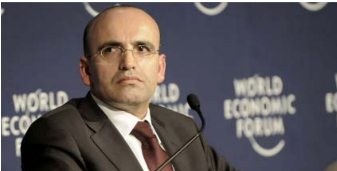
Il Ministro delle Finanze turco, Mehmet Şimşek-