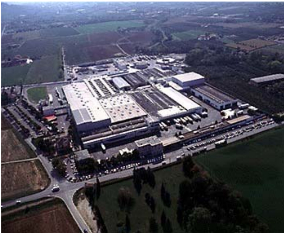
Cremonini - Veduta aerea dello stabilimento Montana-Inalca di Castelvetro di Modena