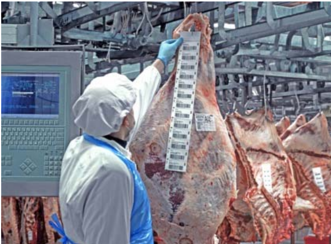
La tracciabilità della materia prima

una banca, in cui sono consigliere di amministrazione, di aprire una filiale a Luanda. I colleghi mi hanno guardato come se fossi stato un alieno. Oggi, in Angola, sono presenti banche di tutti i Paesi, tranne il nostro. Cambiano anche le persone: recentemente sono stato in Burundi, uno degli Stati che nelle classifiche mondiali figura tra i più poveri del mondo e ho incontrato molti giovani. Hanno lo stesso stimolo dei cinesi, l'emulazione. Vogliono conoscere e soprattutto vogliono fare. Non sono diversi da molti neri che lavorano oggi in Emilia. A Castelvetro abbiamo non solo operai ma anche capireparto ghanesi. Alcuni, della prima generazione, hanno iniziato a tornare nel Paese perché vogliono mettere a frutto quello che hanno imparato qui. A noi evidentemente dispiace, perché sono degli eccellenti collaboratori, ma credo che sia giusto così." ■