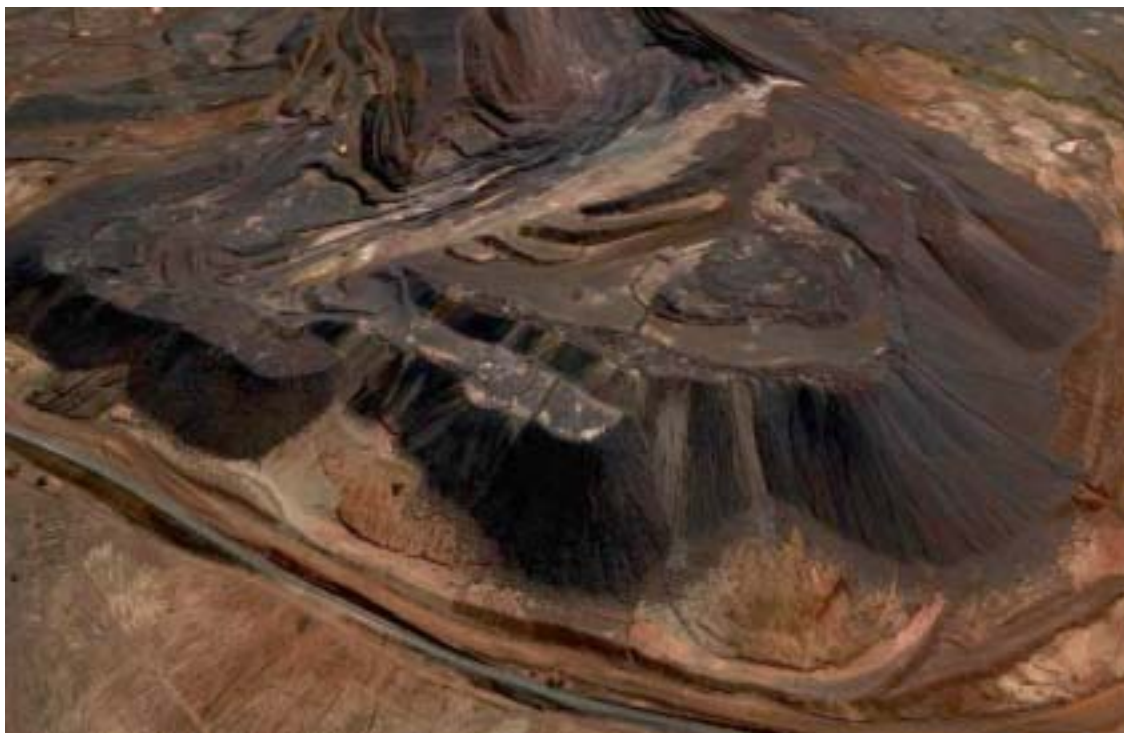
I giacimenti di ferro di Zouerat

Ma una quota rilevante prende anche la direzione della Cina. Il minerale viene trasportato per ferrovia, lungo un percorso di 650 chilometri che serpeggia tra le dune del deserto da convogli che possono raggiungere anche due chilometri e mezzo di lunghezza. ➤