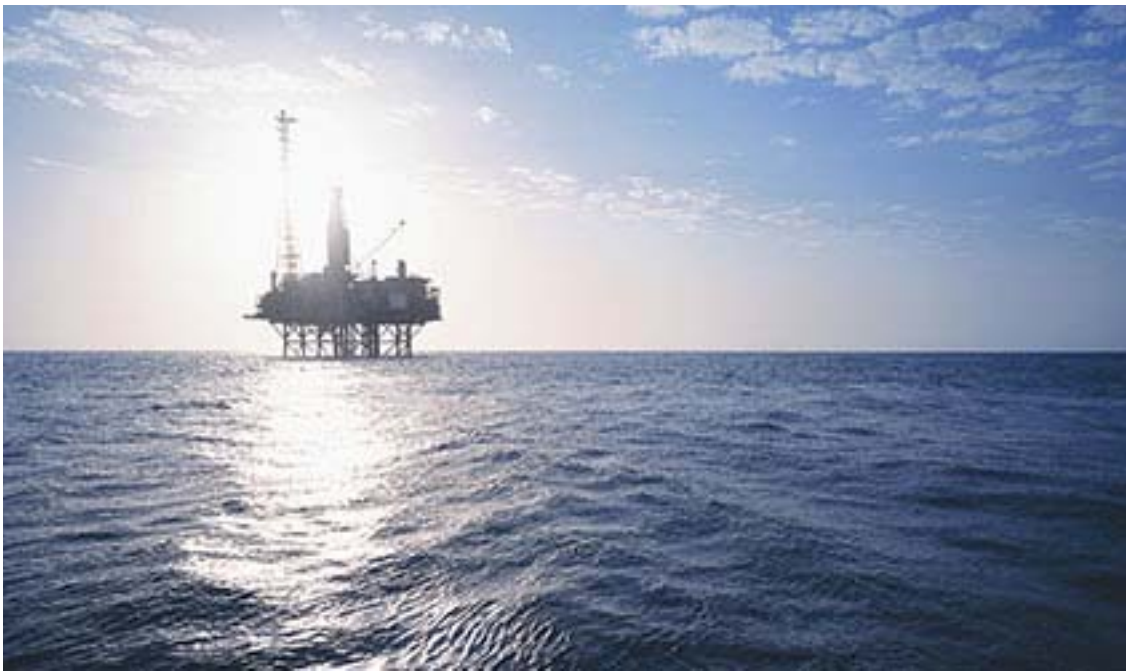
Gordon Lng Project - La piattaforma per l'estrazione del gas

Leggi gli aggiornamenti su www.notiziariofarnesina.ilsole24ore.com