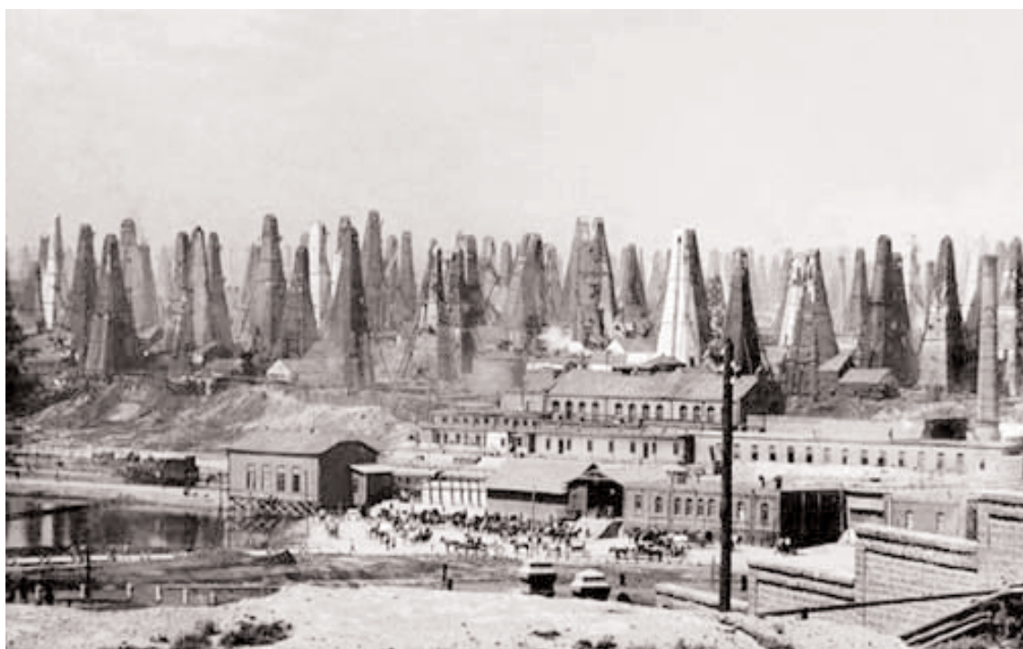
I pozzi petroliferi dei fratelli Nobel a Balakhani, nella periferia di Baku. 1910 circa

no quantitativi minimi: circa 64 barili al giorno. Ma già allora l'impero russo, che aveva occupato il principato di Baku, aveva introdotto un sistema di concessioni a lungo termine (otkupchina) per i campi petroliferi. A partire dal 1870 inizia la produzione industriale e anche la costruzione dei primi oleodotti e di una ferrovia che collega Baku Tbilisi, in Georgia per il trasporto del greggio. Produzione e trasporto fanno capo a una nuova leva di imprenditori, tutti nati da umili origini, che accumulano enormi ricchezze. ▶