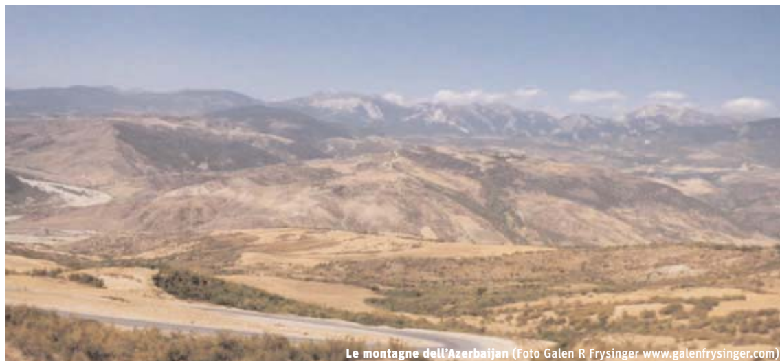
Le montagne dell'Azerbaijan