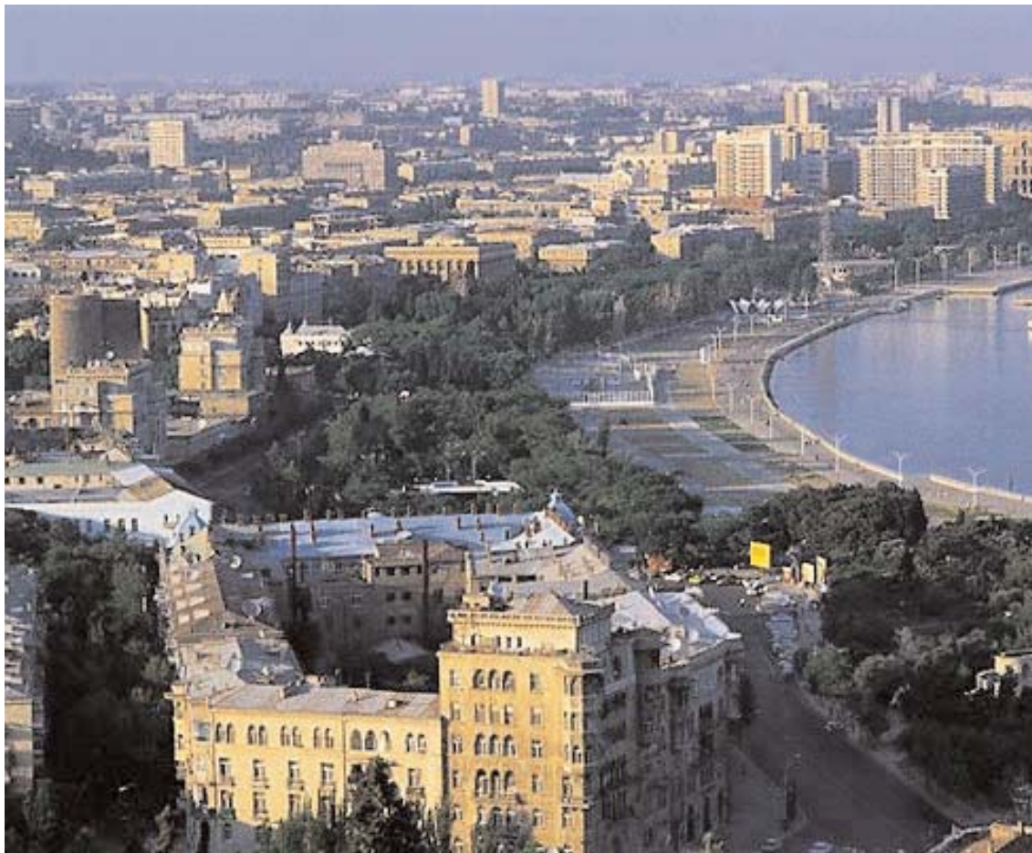
Baku - Il porto della città è noto per essere uno dei migliori del Mar Caspio. La città divenne famosa come centro di scambio sulla Via della seta, ma da un centinaio di anni è il petrolio a trainare la sua economia