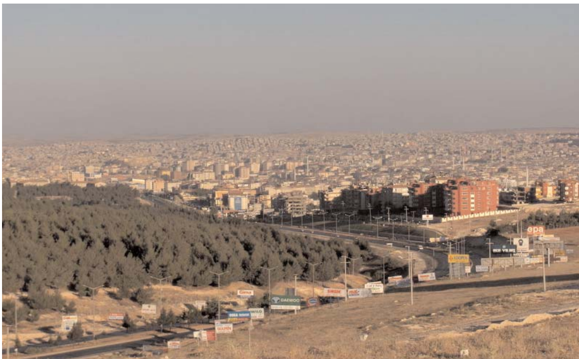
Gaziantep - La città è la più grande della Regione dell'Anatolia Sud Orientale e la sesta della nazione

Una delle attività che offre le maggiori opportunità di investimento è inoltre il turismo. Le infrastrutture alberghiere infatti, sono tuttora piuttosto carenti, benché la zona offra itinerari di grandissimo interesse che coprono resti di civiltà mesopotamiche, architettura religiosa e civile di epoca tardo romana, bizantina ed islamica con antiche moschee, bazaar e piccoli musei di grande interesse. Quelli di Gaziantep e Sanliurfa ospitano anche alcuni splendidi mosaici. »