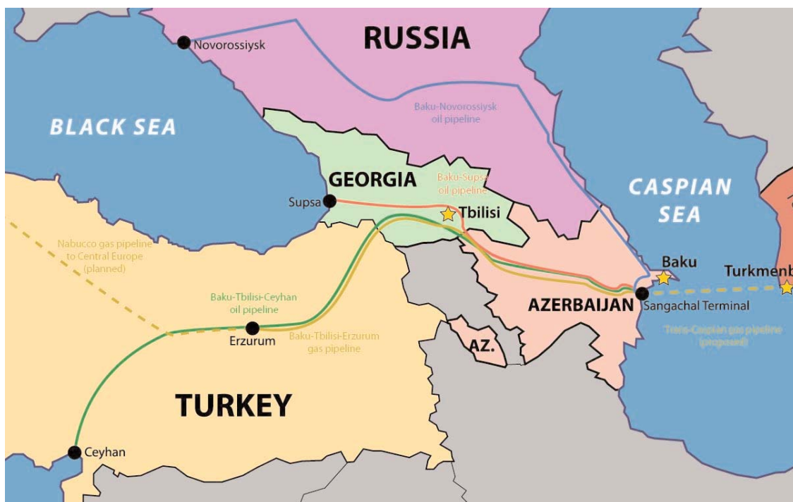
L'oleodotto che collega Baku (Azerbaijan) con Tbilisi (Georgia) e Ceyhan (Turchia)