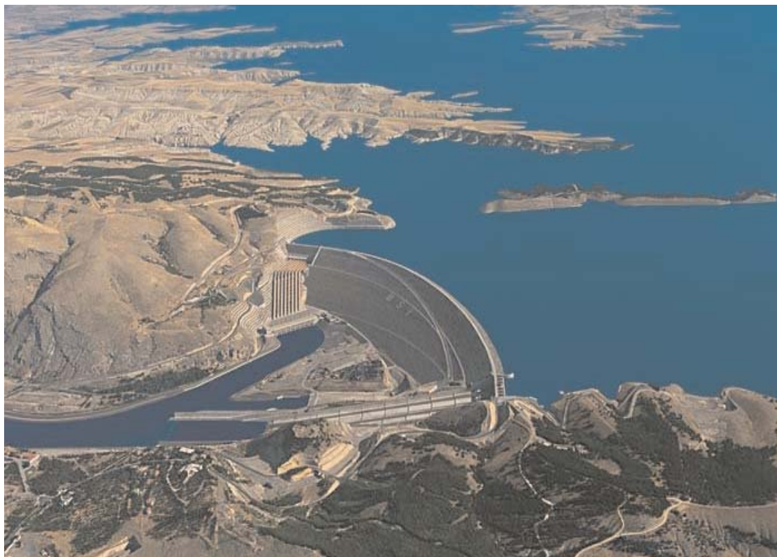
Ataturk Dam - In turco "Atatürk Barajı" e originariamente "Karababa Dam", è una diga sull'Eufrate situata al confine delle province di Adiyaman e di Sanliurfa in Anatolia. Ideata sia a scopo di generare energia idroelettrica, sia per creare un bacino per l'irrigazione, è stata costruita tra il 1983 e il 1990

Dopodiché la situazione varia a seconda delle Province. La città di Gaziantep, ad esempio, è ormai un importante centro industriale con produzioni tessili, agroalimentari, di componentistica »