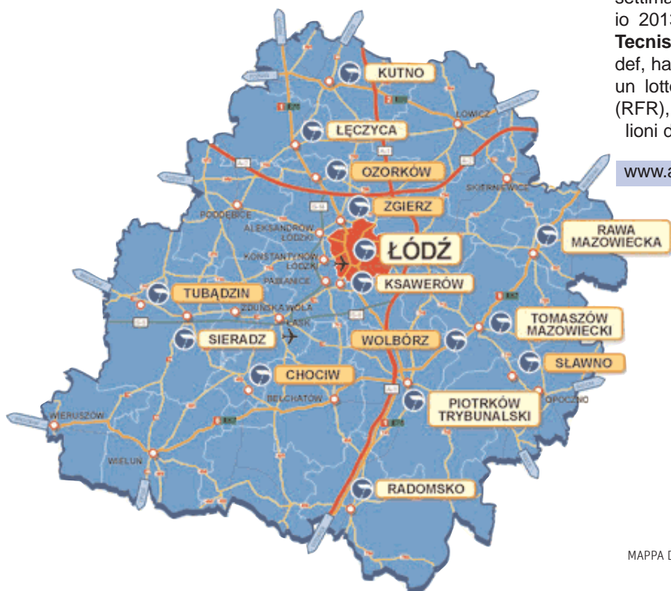
MAPPA DELLA ZONA ECONOMICA SPECIALE DI ŁÓDŹ