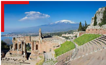
Parc archéologique de Naxos et Théâtre de Taormina

L'Algérie et l'Italie partagent une longue histoire qui remonte à l'Antiquité mais s'est poursuivie au-delà avec de riches interactions qui ont donné naissance, à l'époque moderne, à une amitié profonde entre les deux pays, leurs peuples et leurs États. L'esprit de coopération et de solidarité qui anime ces relations a trouvé dans le patrimoine culturel un fort ancrage symbolique où l'appartenance commune à la Méditerranée s'exprime aussi bien dans des valeurs que des actions. La collaboration entre les deux pays pour la conservation, la restauration et la promotion des biens culturels a inscrit de belles pages dont témoignent déjà plusieurs opérations, y compris au chapitre de la formation. L'Algérie et l'Italie apportent ainsi la preuve qu'il est plus aisé de regarder ensemble l'avenir en valorisant les héritages du passé. Cette journée, qui prend la forme d'un bilan de la coopération bilatérale autour du patrimoine culturel algérien, se propose aussi d'envisager les voies et moyens de la développer.