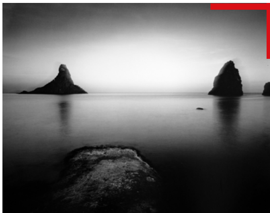
Paysage marin, Acitrezza, Sicile, Italie (de la série Méditerranée), 1990 - 1995